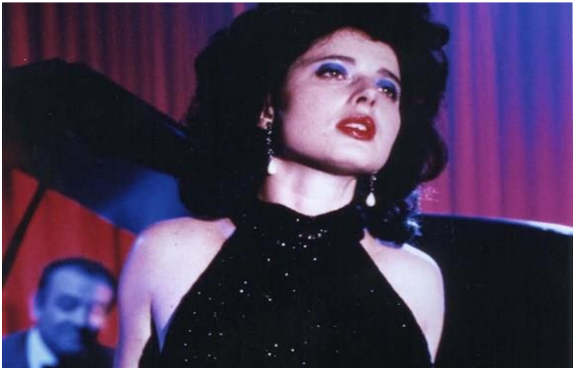
Slika 11. Dorothy Vallens u filmu "Blue Velvet" 26

Prvi put kada susrećemo Dorothy Vallens – u njezinu duboko ružičasto nijansiranom stanu kada Jeffrey ulazi prerušen u istrebljivača insekata – ona je odjevena u crvenu, svilenu haljinu u tipu ogrtača, koja, iako senzualna u tonu i teksturi, namjerno je nezavodljiva i neformalna u kroju (ona čeka posjetu enigmatičnog „Yellow man-a“). Njena kosa i šminka, su pak dramatične – voluminozna kovrčava smeđa kosa, jarko crveni ruž i istaknuto plavo sjenilo za oči – ostaju njezin prepoznatljivi izričaj kroz cijeli film. Lynch prekriva prelijepu Rossellini apsurdno pretjeranim „glamurom“, činjenica je koja čini Vallensin karakter još mističnijim.