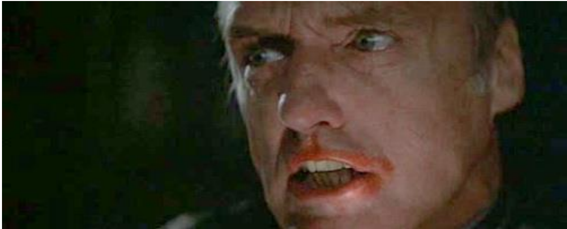
Slika 14. Frank Booth u filmu "Blue Velvet" 30

U zadnjoj sceni filma, Dorothy pak nosi običnu smeđu bluzu, izgledajući tako puno manje izuzetno i zavodljivo nego u dotadašnjim kombinacijama, a više kao zadovoljna majka, koja sad napokon može postati. Neobičnom mješavinom ranjivosti i senzualnosti, ljepote i pretjeranog glamura, Vallens je postala jedna od najkoničnijih filmskih heroína.