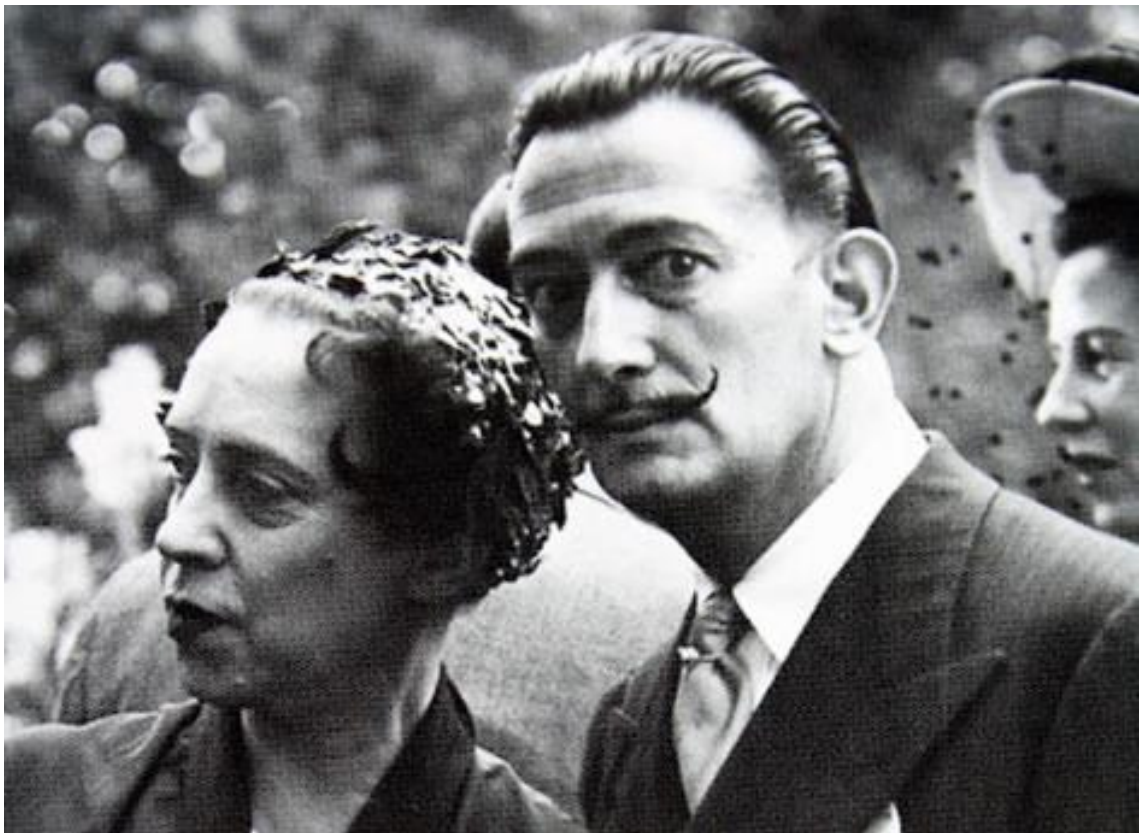
Slika 5. Schiapparelli i Dalí 16

„Konstantna tragedija života je moda i to je razlog zašto sam uvijek volio surađivati sa [...] gospođicom Schiapparelli, samo da dokažem da je ideja odijevanja, ideja prekrivanja samog sebe, samo posljedica traumatskog iskustva rođenja, koje je najjače od svih trauma koje ljudsko biće može doživjeti, pošto je prvo.“