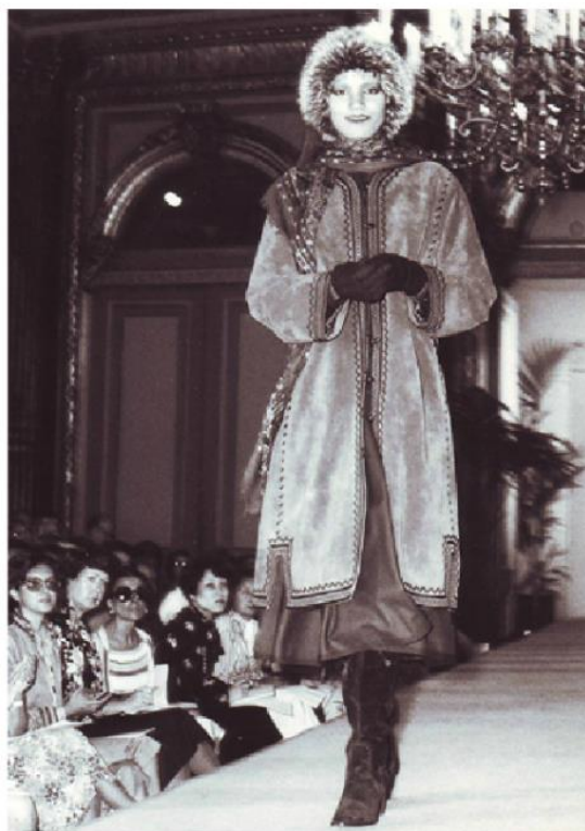
(sl.28,29) – YSL, kolekcija 1976.god u Inter Continental Hotelu