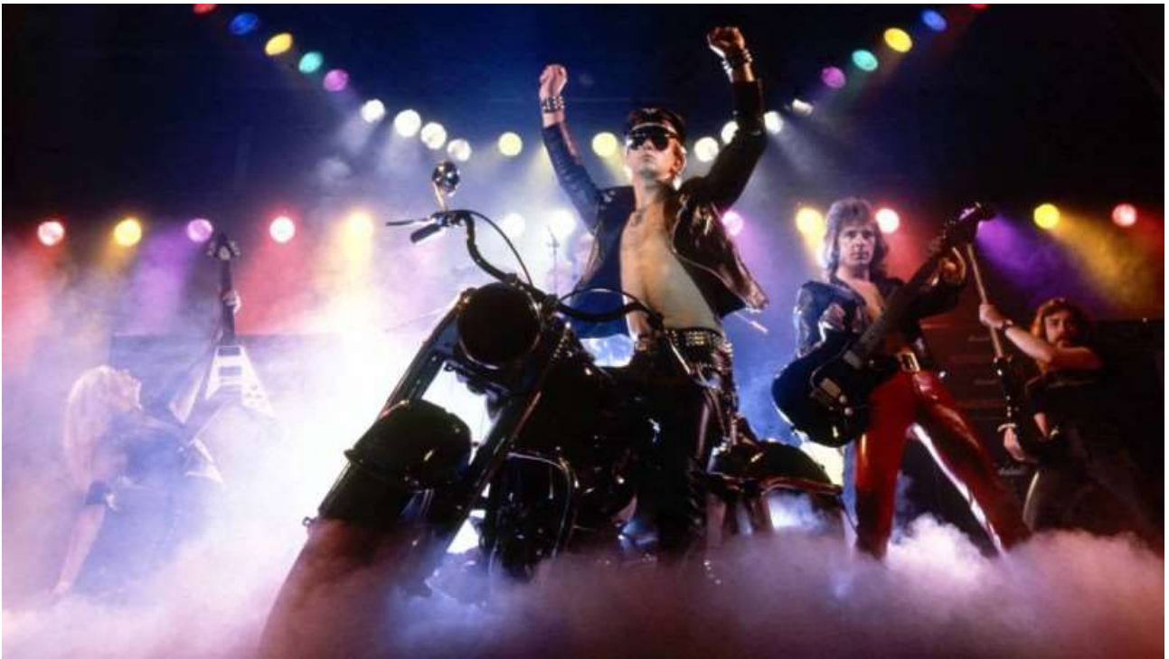
Slika 5.: Koncert Judas Priesta 1979.

Heavy metal postaje najkontroverznijim smjerom te ga se i danas takvim smatra. Tekstovi pjesama zvuče kao horror priče, a mladi naraštaji u želji za što strašnijim izgledom počinju nositi tamnu šminku, leće u bojama pa čak i vampirske zube.