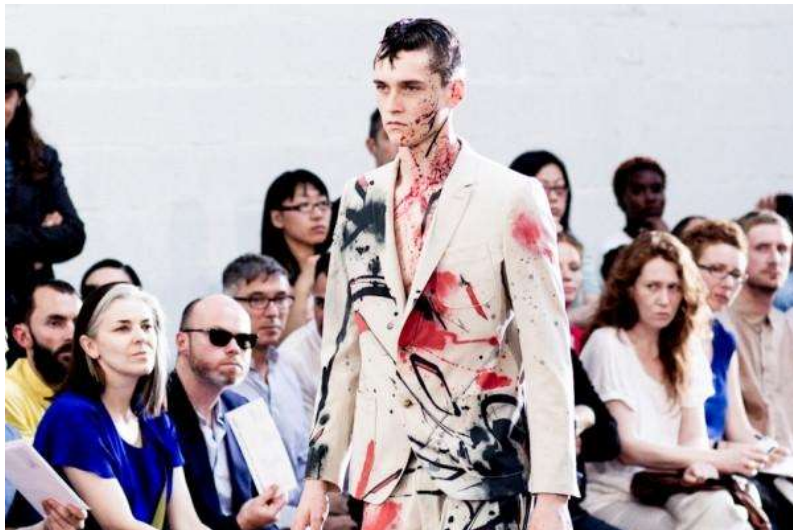
(slika br. 7, Mihara Yasuhiro, SS 13)