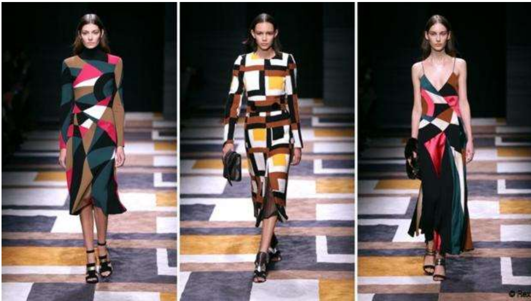
(slika br. 3, Massimiliano Giannetti A/W 2015)

Massimiliano Giannetti za jesen/zimu 2015 kreirao je kolekciju u kojoj je naglasak stavio na dezone više nego na sam kroj haljina. Krojevi su elegantni i ženstveni ali snaga dezone stavlja ih u drugi plan. Kroz cijelu kolekciju protežu se plohe geometrijskih oblika kontrastne boje. Materijali su laganiji, a na nekim modelima i kombinirani s drugom vrstom tkanine gdje se stvaraju nabori. Cijela scena usklađena je s kolekcijom zbog tepiha koji je u dezonu, kao i haljina s kojom je bila zatvorena kolekcija. Zbog kontrasta boja i geometrije na pojedinim dijelovima modeli haljina izgledaju kao da imaju proreze. Igrom rasporeda oblika stvara dojam treperenja koji daje živahnost i slobodu a istovremeno imamo dojam profinjenosti i kontrole. Nužno je dodati da su Sonjini radovi imali velik utjecaj na nastanak ove kolekcije, ali i sam dizajner je to spomenuo u jednom od intervjua s novinarima.