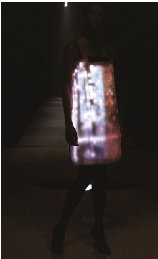
SI 1. Hussein Chalayan "Airborne" Autumn/Winter (2007), London UK