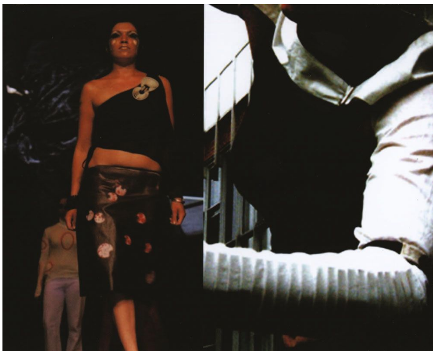
SI 8. CuteCircuit "Emotional Clothing: Skirteleon" (2004), Rome, Italy