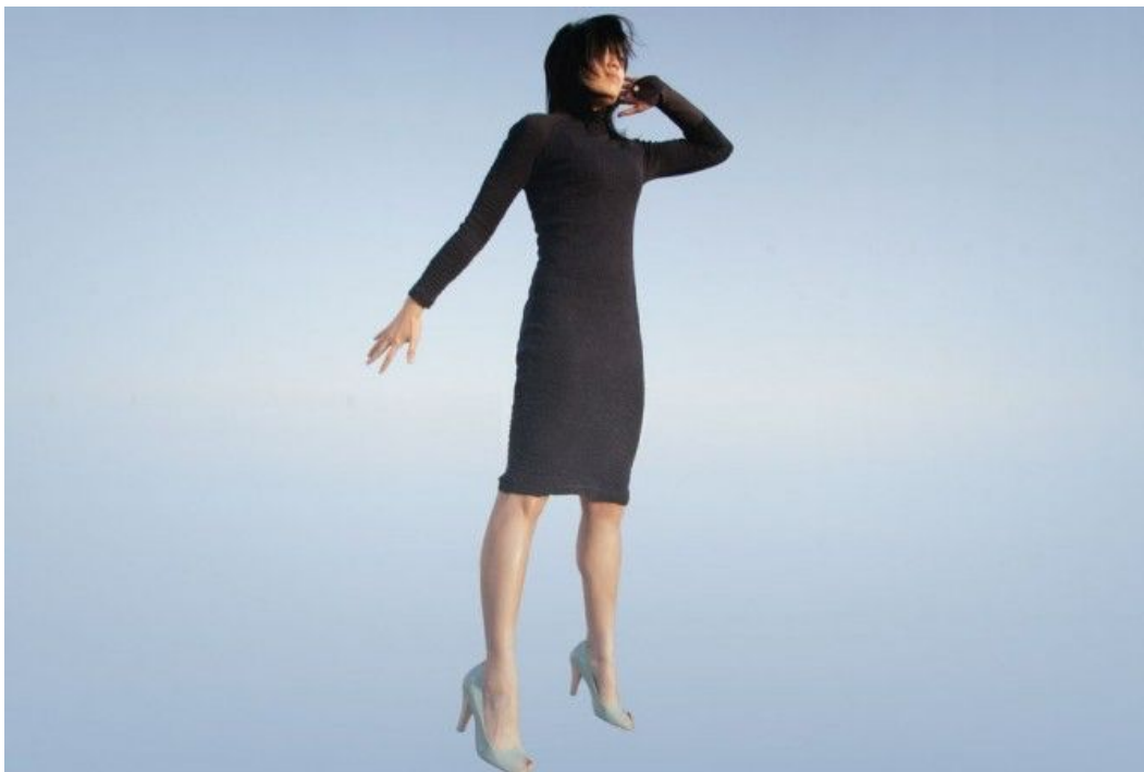
SI 5. CuteCircuit "M-Dress (Mobile Phone Dress)" (2007), London UK

Glavna tema zbirke bila je brzina s pridruženom tehnologijom. Zrakoplovna haljina je konstrukcija od stakloplastike s krilima kojom se može upravljati elektronički i kreće se poput krila iz zrakoplova. (slika 4) 58