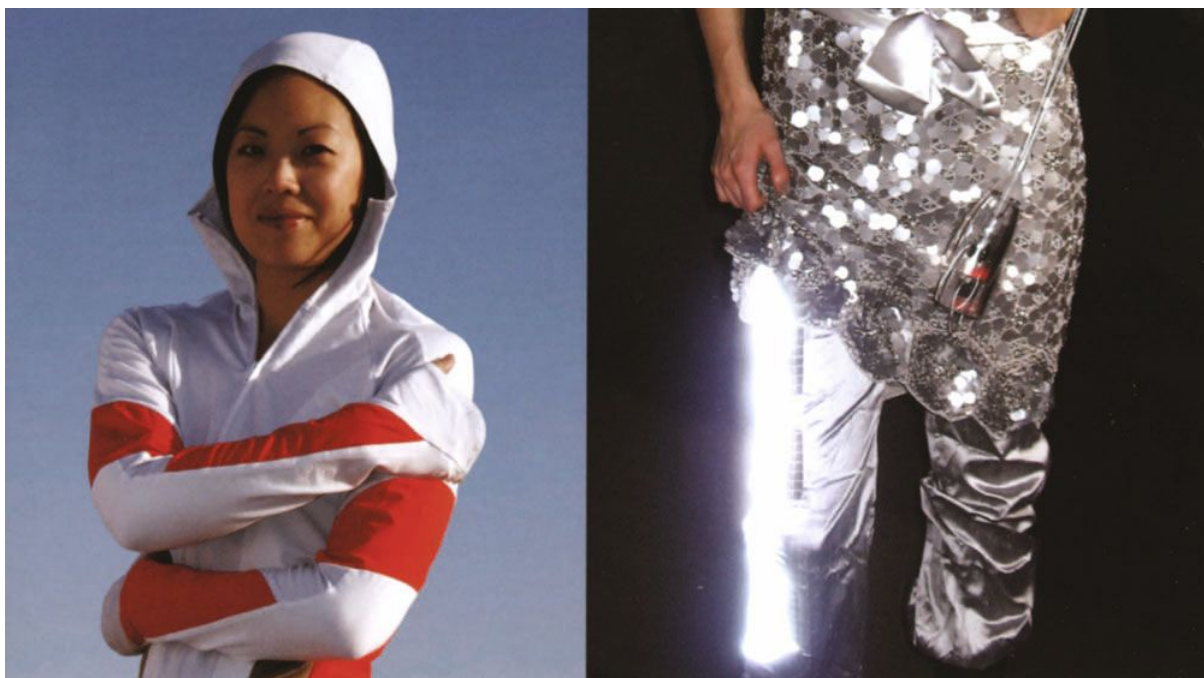
Sl. 6. CuteCircuit 'Hug Shirt' (2002 - ongoing), London UK