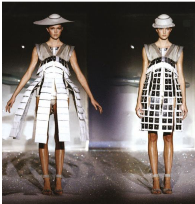
SI 2. Hussein Chalayan "One Hundred and Eleven" Spring/Summer (2007), London UK