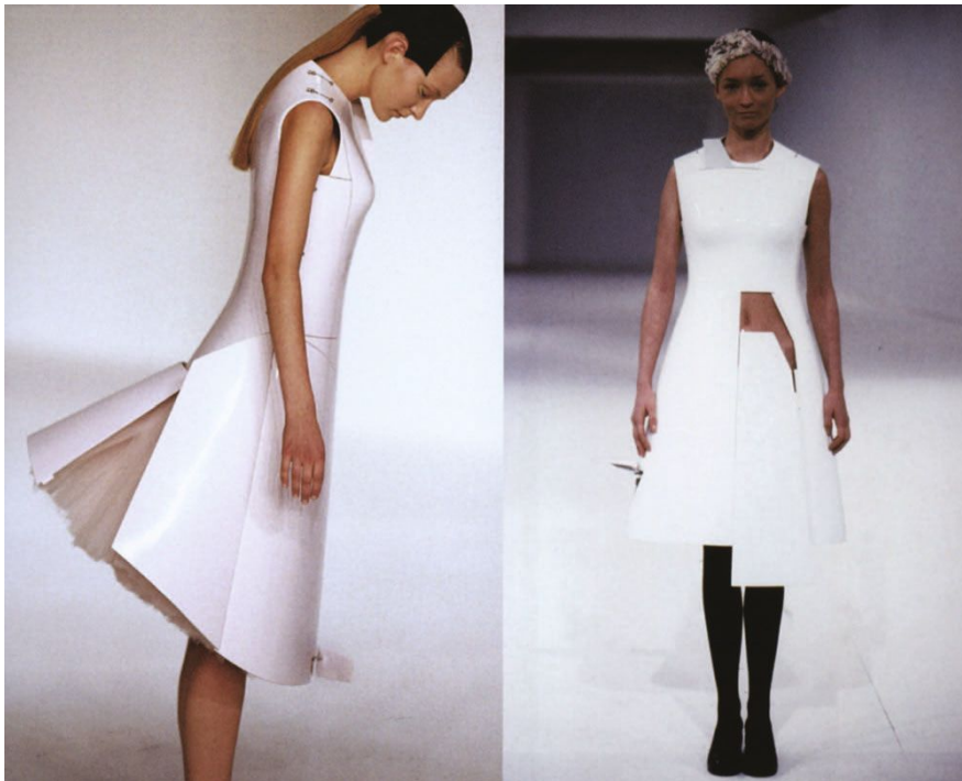
Sl. 3. Hussein Chalayan "Before Minus Now" Spring/Summer (2000), London UK

Udruženje sa Swarovskim dovelo je do kolekcije koja nadilazi 111-godišnju modnu povijest i otkriva modernu i jedinstvenu viziju. Svaka od pet prekrasno ručno izrađenih mehaničkih haljina predstavlja određeno razdoblje u povijesti mode, u koju su uključene suvremene vizije i složeni inženjering. 1895. polazna je točka za kolekciju, koja se sastoji od suknje s čvrsto uvučenim strukom na haljini s visokim, prstenastim dekolteom. To se pretvara u labaviju haljinu s potkošuljom koja se uzdiže do lista odražavajući stil 1910. Zauzvrat, neprimjetno se preobražava u haljinu od platna iz 1920-ih koja se sastoji od labave slojevite suknje dužine koljena i plutajućeg dekoltea. Metamorfoza se nastavlja sve do danas. (slika 2) 57