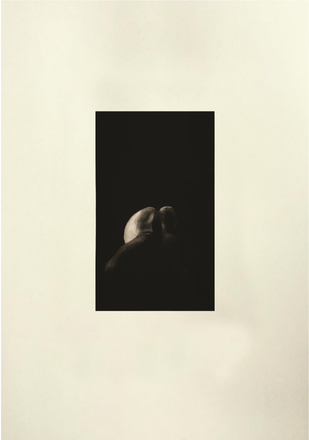
10. slika: „ Druga kompozicija “