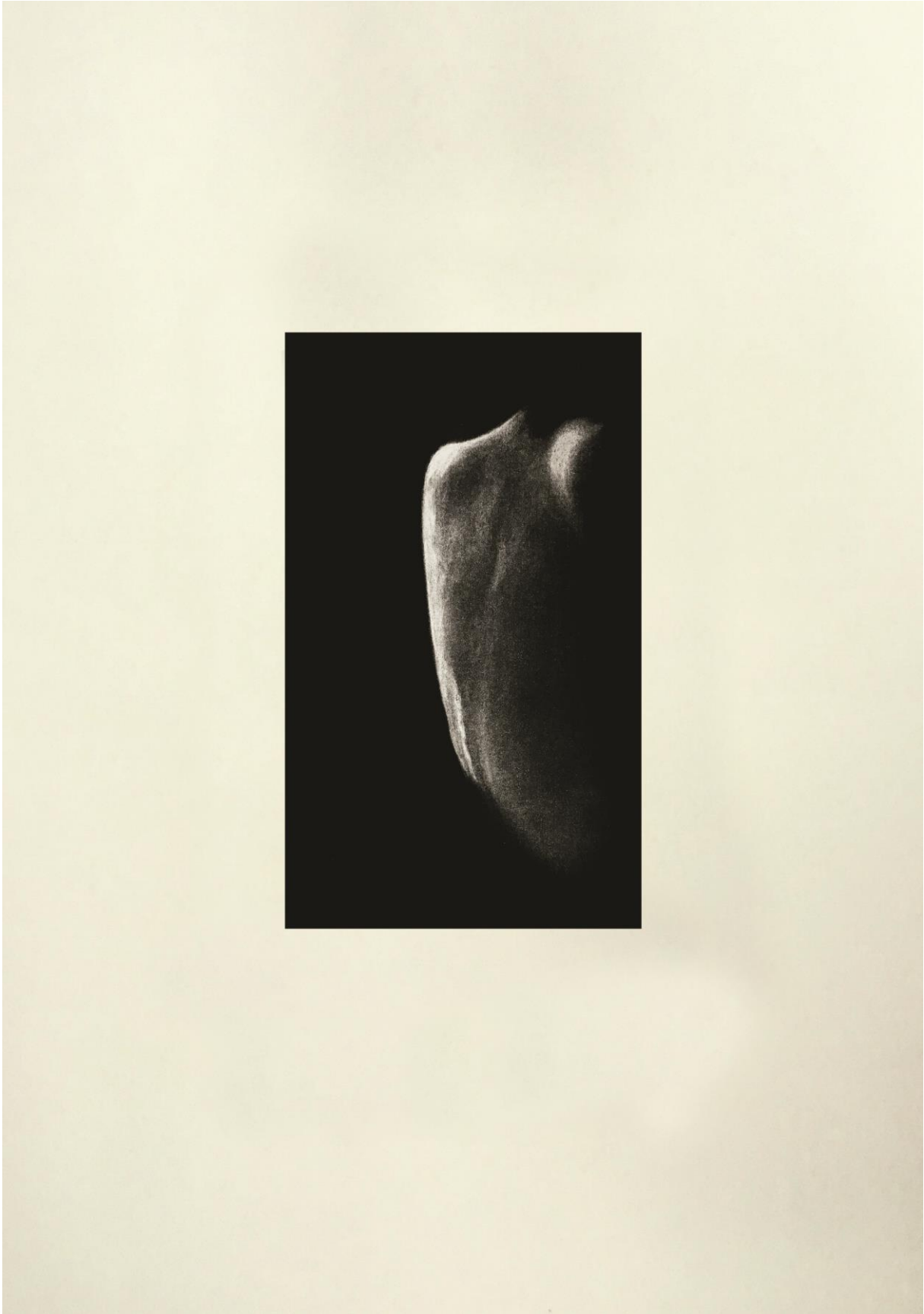
9. slika: „Prva kompozicija“