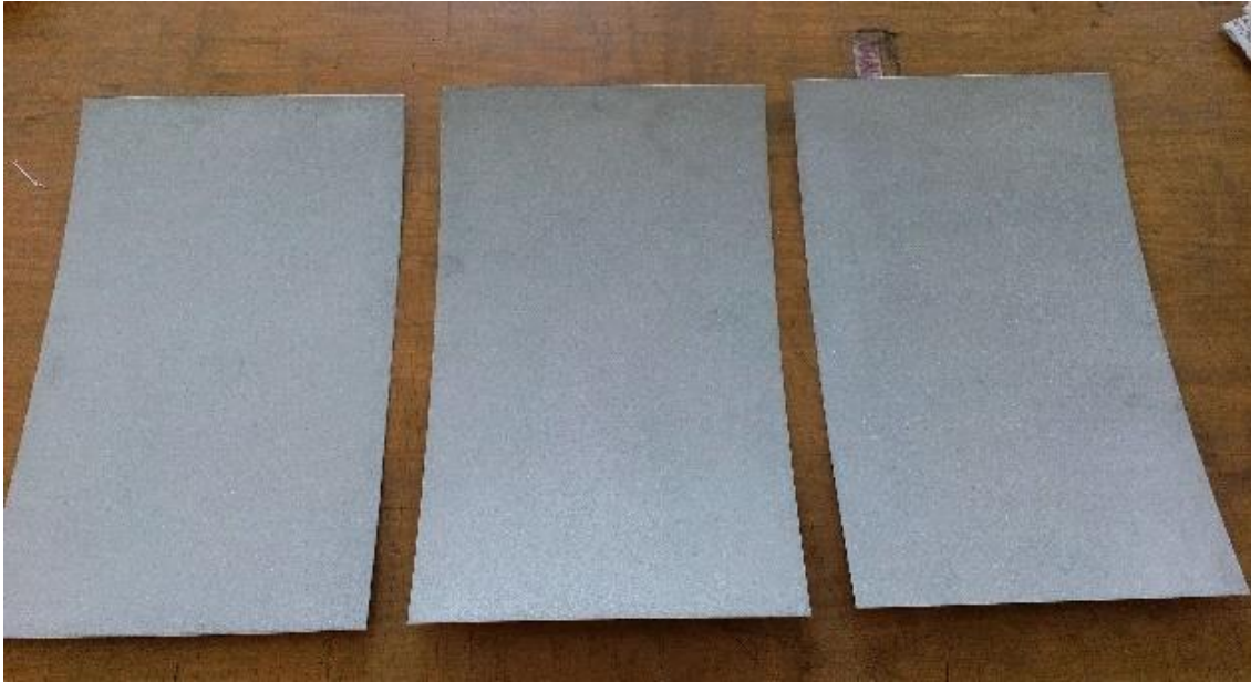
4. slika: pripravljene matrice