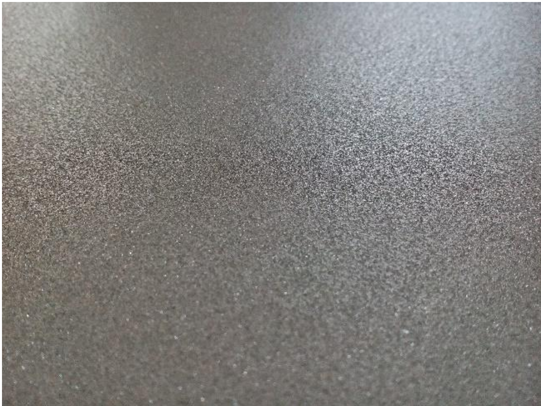
5. slika: detalj strukture metalne ploče