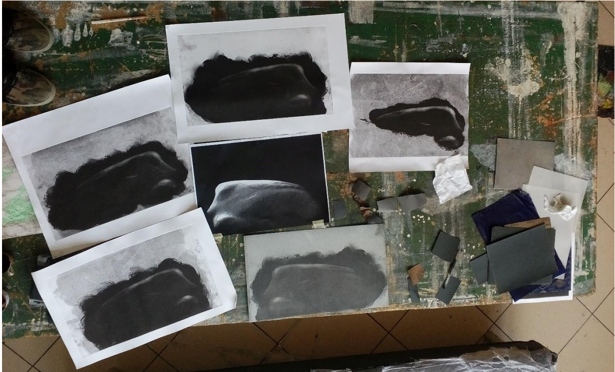
7. slika: proces nastanka „Prve kompozicije“

Na svim trima matricama radio sam simultano postupno upoznavajući tehniku i skupljajući iskustvo na svakoj pojedinačnoj matrici, koje sam onda primjenjivao na ostalim. Drugu matricu sam započeo koristeći isključivo šaber i gladilicu, bez upotrebe brusnog papira. Postupak je isti kao i na predhodnoj matrici, precrtao sam motiv i krenuo u izbjeljivanje ploče, od najsvjetlijih tonova čiste bijele do najtamnijih. Mekim brusnim papirom sam u završnoj fazi intervenirao finom obradom tonkih prijelaza kako bi dobio što vjerniji prikaz volumena. Nakon kontrole kompletne obrade kroz probne otiske, „ Drugu kompoziciju “ (10. slika) sam otisnuo na grafički papir Fabrianno da mogu vidjeti kako izgleda rad u svom konačnom obliku. Potom sam se usmjerio na posljednji motiv, dok sam prvu matricu, s kojom sam bio najmanje zadovoljan, ostavio za kraj.