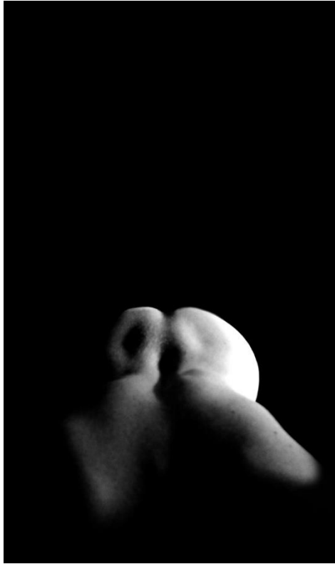
2. slika: druga fotografija