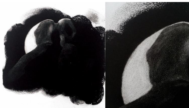
8. slika: proces nastanka „Druge kompozicije“ i detalj teksture

Na svim trima matricama radio sam simultano postupno upoznavajući tehniku i skupljajući iskustvo na svakoj pojedinačnoj matrici, koje sam onda primjenjivao na ostalim. Drugu matricu sam započeo koristeći isključivo šaber i gladilicu, bez upotrebe brusnog papira. Postupak je isti kao i na predhodnoj matrici, precrtao sam motiv i krenuo u izbjeljivanje ploče, od najsvjetlijih tonova čiste bijele do najtamnijih. Mekim brusnim papirom sam u završnoj fazi intervenirao finom obradom tonkih prijelaza kako bi dobio što vjerniji prikaz volumena. Nakon kontrole kompletne obrade kroz probne otiske, „ Drugu kompoziciju “ (10. slika) sam otisnuo na grafički papir Fabrianno da mogu vidjeti kako izgleda rad u svom konačnom obliku. Potom sam se usmjerio na posljednji motiv, dok sam prvu matricu, s kojom sam bio najmanje zadovoljan, ostavio za kraj.