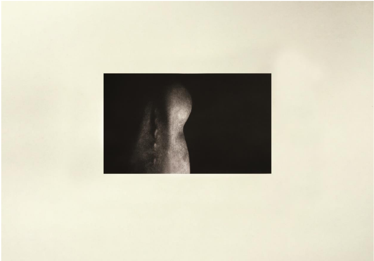
11. slika: „ Treća kompozicija “