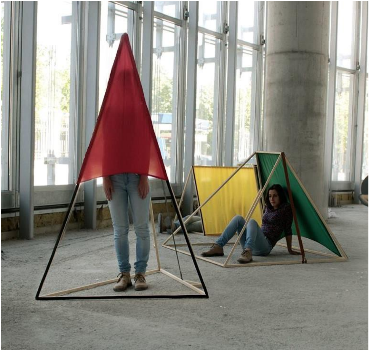
Prilog 5: Moj kamp , fotomontaža