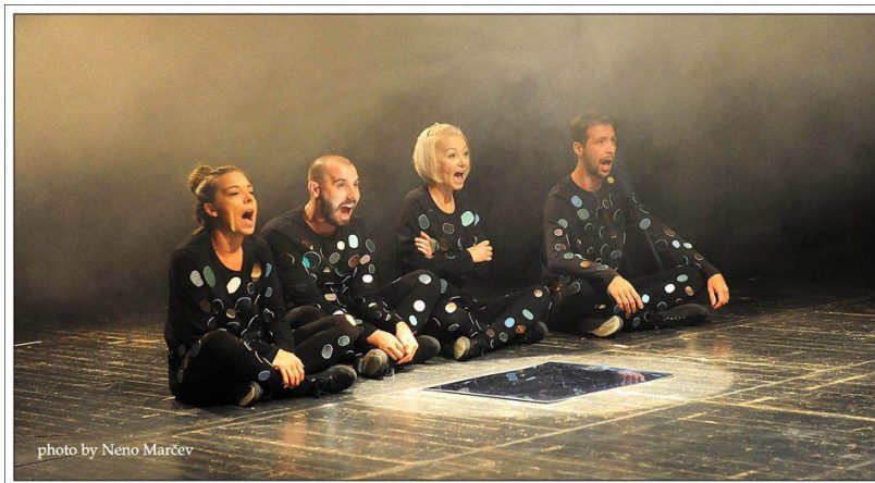
Slika 4: neutralni kostimi sa ogledalcima

prilagođavajući se glumčevoj gesti, kretanju, držanju; čas to tijelo steže. Tako kostim naizmjenično, a katkad i istovremeno, ima u sebi nešto od živog bića i od neživa predmeta. 15