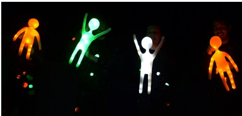
Slika 6: silikonske lutke sa LED svjetlima

Često su se kod nas prije niz godina mogli čuti uzvici: Što su to krasne lutke, izgledaju kao pravi ljudi. Ništa gore se za lutku ne može reći. Ništa nije pogrešnije nego tražiti da lutka govori, da se kreće i ponaša kao živ čovjek. Što je lutka sličnija živom čovjeku, to je kao lutka mrtvija, dosadnija i nakaznija. 16