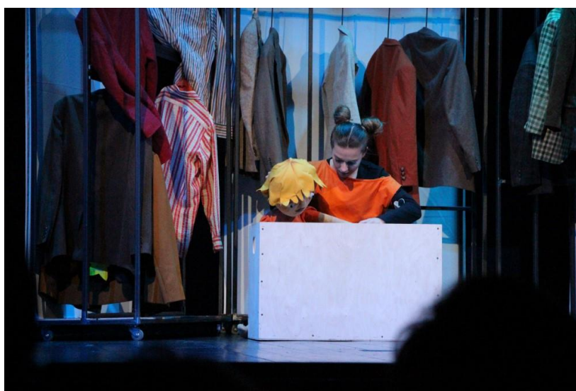
Slika 2: scenografija sobe

Budući da se scenografija uvijek primjenjuje na konkretan način, ona će, osim što je svojim specifičnim oblikom kadra pobliže karakterizirati prostor što ga znači, karakterizirati i radnju koja bi se u tom prostoru mogla odigrati. Budući da scenografija znači praktičnu funkciju prostora koji označava, ona ujedno ispunja dodatnu znakovnu funkciju da uputi na neku situaciju ili radnju. 13