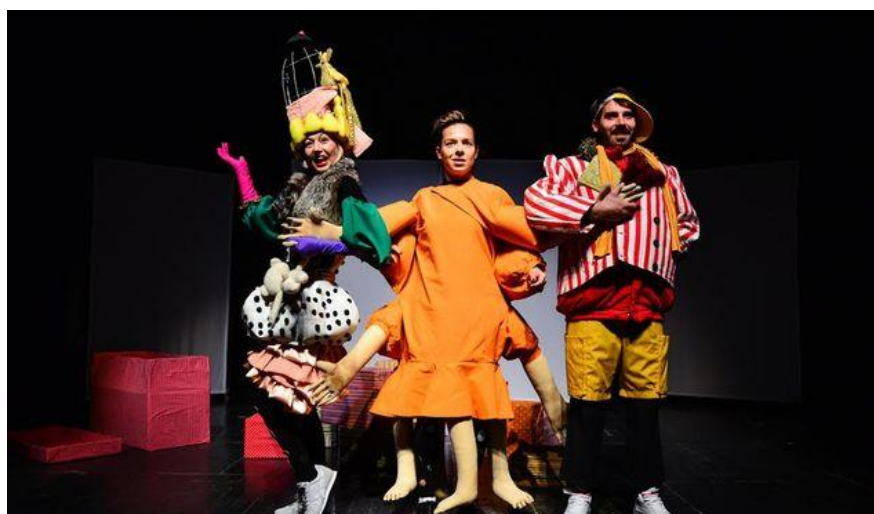
Slika 5: kostimi roditelja i kostim Nevidljive sa dodanim rukama i nogama

simbolizira pretrpanost, površnost, materijalizam te slijepo praćenje vanjskih poticaja, ne kreirajući vlastitu sliku svijeta i samoga sebe. Vođeni takvim idealima postajemo čudovišta, što sam ovaj kostim, kao vanjski simbol, i donosi