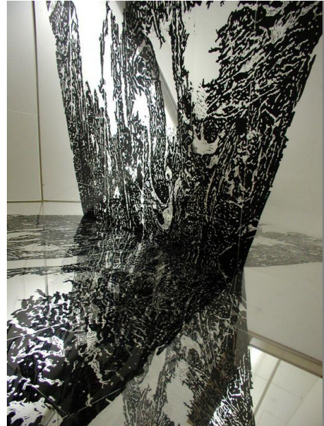
Slika 2. „BABEL“ poledina drvorez na foliji 2007 Slika 3. „PROSTOR“ drvorez na foliji detalj 2007.

koja u ovom slučaju prikladno za motiv uzima modernu ikonografiju nebodera s neonskim reklamama na vrhu zgrade. Dvije identične okomice nebodera, dobivene inverzijom zrcaljenja, spojene su pod kutom prema unutra. Na taj se način “plašt” zgrade iracionalno udvostručuje i razvija, umjesto da zatvara volumen.