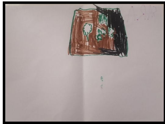
Crtež 4. NAŠ VRT (djevojčica S., 5 g.)