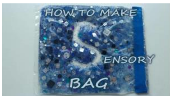
Slika 4: Senzorna vrećica