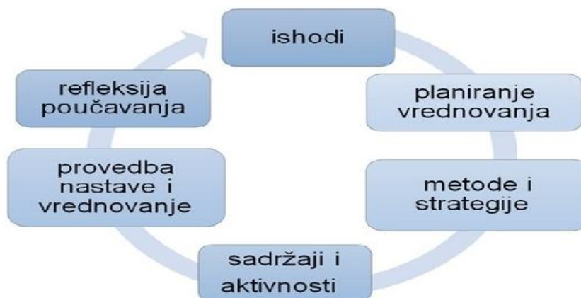
Slika 1:, Kurikulumski krug poučavanja (Jurjević Jovanović i suradnici, 2022).

Posljednji, četvrti korak označava provedbu nastave tijekom koje se kontinuirano provodi i vrednovanje. Kurikulumski krug, odnosno proces poučavanja tijekom nastavnog procesa završava refleksijom na proces učenja i poučavanja. Učitelj analizira razinu ostvarenosti odgojno-obrazovnih ishoda aktivnosti, analizira odabrane sadržaje, aktivnosti i metode učenja te procjenjuje razinu aktivnosti i interesa učenika tijekom poučavanja. (Jurjević Jovanović i sur. 2020, 2022).