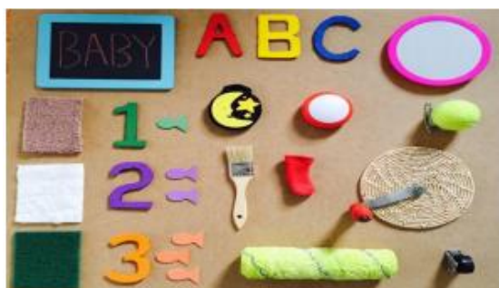
Slika 5: Senzorna ploča