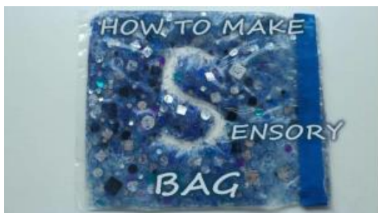
Slika 4: Senzorna vrećica