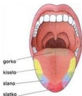
Slika 3: Osjetilni pupoljci