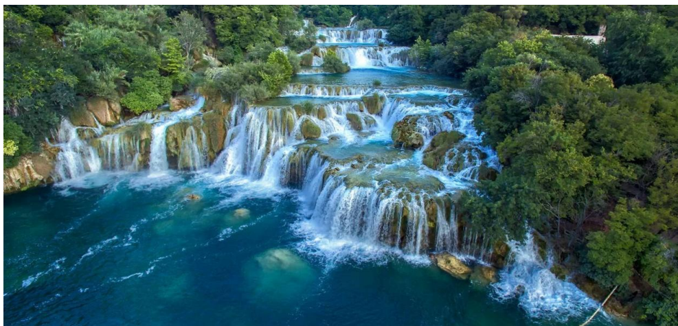
Slika 11. Skradinski buk u NP Krka.

buk sa svojih 17 stepenica na dužini od 800 m, visinom od 45,7 m i širinom 200-400 m najveće je sedreno slapište u Europi. U podnožju Skradinskog buka počinje potopljeni dio Krke (estuarij), odnosno dio u kojem se miješaju riječna i morska voda, stvarajući akvatorij sa specifičnim živim svijetom bočatih voda.