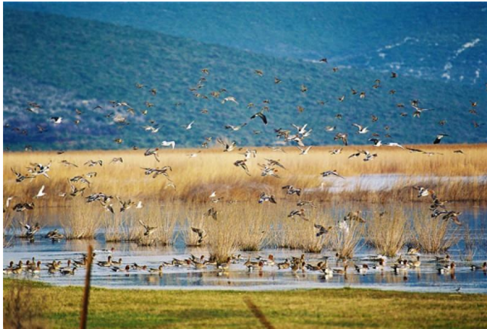
Slika 14. PP Vransko jezero stanište je brojnih ptica.

scrofa ), šumski miš ( Apodemus sylvaticus ), štakor selac ( Rattus norvegicus i zec ( Lepus europaeus ). Dalmatinski krški puh ( Eliomys quercinus dalmaticus ) i primorski dugouhi šišmiš ( Plecotus kolombatovici su endemične svojte Dalmacije ( http://www.pp-vransko-jezero.hr/hr/ ). Na jezeru je zabilježen i velik broj kukaca. U Parku su nađene 133 vrste pauka, od čega je čak 15 vrsta po prvi puta zabilježeno u Hrvatskoj (Mrakovčić, Mišetić, Plenković-Moraj, Grilca, Mihaljević, Čaleta, Mustafić, Kerovec, Pavlinić, Zanella, Buj, Brigić, Gligora i Kralj, 2004).