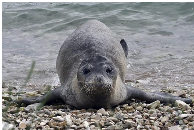
Slika 8. Sredozemna medvjedica.

Sredozemna medvjedica ( Monachus monachus ) jedna je od najugroženijih vrsta i najmalobrojnijih sisavaca na svijetu. Spada u porodicu tuljana ( Phocidae ). Jedini predstavnik sisavaca perajara u Sredozemnom moru. Prvi put je znanstveno opisana 1779. godine na temelju primjerka pronađenog na otoku Cresu. Rasprostranjenost joj je vrlo fragmentirana, uključujući umjerene i suptropske vode Sredozemnog mora i istočnog Atlantskog oceana. Danas njezina ukupna populacija ne prelazi 320-475 jedinki (Antolović, Frković, Grubešić, Holcer, Vuković, Flajšman, Grgurev, Hamidović, Pavlinić i Tvrtković, 2006). Povećanje ljudskog pritiska i narušavanje pogodnih staništa dovelo je do promjene društvenog ponašanja ove vrste. „Ribari su medvjedicu oduvijek mrzili i bezobzirno je uništavali“ (Tutman, 1981, str. 118). Nekad društvenu vrstu koja je tvorila kolonije, danas češće nalazimo kao usamljene jedinke ili u malim izoliranim skupinama od 5 do 7 jedinki. Zadržava se na području okota i koristi špilje tog područja čija je unutrašnjost sa šljunčanim žalom ili kamenom pločom. Hrani se mekušcima, glavonošcima i ribama. Zaranja do 25 metara dubine i pod morem se zadržava 5 do 7 minuta. Mlado nosi 9 do 11 mjeseci. Koti jedno mlado svake druge godine koje doji 2 mjeseca te nakon toga ono postaje samostalno. Doživi i više od 30 godina. Medvjedica (Slika 8.) ima izvrsno razvijen sluh, vid i njuh.