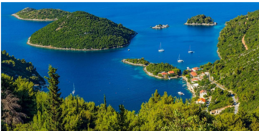
Slika 12. Šume i bujna vegetacija Mljeta.

Nacionalni park Mljet, prvo morsko zaštićeno područje u Hrvatskoj, osnovan je 11. studenog 1960. godine. Obuhvaća površinu od 31 km 2 , uključujući i morski pojas 500 m od obale, otočića i hridi te tako zauzima otprilike 1/3 otoka. Morem potopljene zaljevi, Malo i Veliko jezero, najistaknutije su lokacije ovog područja te važan geomorfološki i oceanografski fenomen. Glavni motivi za status nacionalnog parka izuzetna su specifična obalna razvedenost te bujan biljni svijet (Slika 12.), odnosno šumovitost područja.