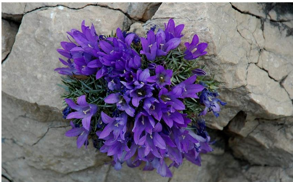
Slika 5. Biokovsko zvonce.