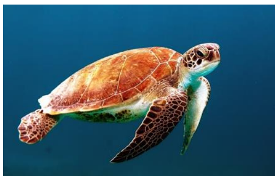
Slika 9. Glavata želva.

Glavata želva ( Caretta caretta ) vrsta je morske kornjače koja, kao i kopnene kornjače, spada u Chelonia . Morske su kornjače jedini gmazovi koji naseljavaju Sredozemno i Jadransko more. Jedna od najtipičnijih osobina morskih kornjača je oklop, čvrsta koštana struktura koja prekriva gotovo cijelo tijelo te sve unutarnje organe. Kod odraslih glavatih želvi (Slika 9.) oklop je ovalnog oblika, s gornje je strane crvenkasto-smeđ, a s donje žut (Dodd, 1988). Građen je od velikih proširenih rebrenih kostiju, prekrivenih rožnatim pločama. Odrasle jedinke dostižu duljinu oklopa i do 110 cm i tjelesnu težinu do 115 kg. Ime je dobila prema karakteristično velikoj glavi sa snažnim čeljusnim mišićima.