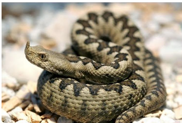
Slika 6. Poskok.

Pari se potkraj travnja do početka svibnja, a ženka od rujna do listopada okoti 10 do 20 mladih, koji odmah poslije izlaska iz majčina tijela probiju nježnu opnu jajeta. Životni vijek mu je do 15 godina. Neprijatelji su mu ptice grabljivice i male zvijeri, posebno orao zmijar i mungosi. Voli suha kamenita područja s dosta grmlja. Aktivan je većinom noću, a danju sklupčan spava probavljajući hranu. Sporiji je, tromiji i otrovniji od ridovke. U hladnijim krajevima spava zimski san, a posebno je opasan u jesen, kada se penje na drveće gdje dočekuje ptice, a tada lako strada i čovjek, ako neoprezno prolazi i dotakne ga. Ugriz poskoka za ljude može biti smrtonosan i zato je potrebno dobro paziti prilikom boravka u prirodi. Zakonom je strogo zaštićen i ne smije ga se ozljeđivati, ubijati te uzimati iz prirode.