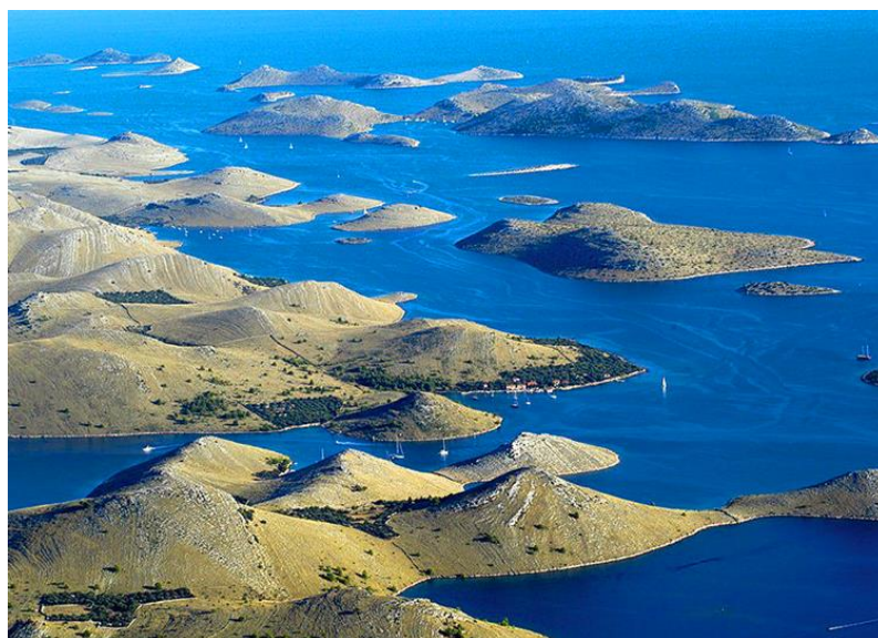
Slika 10. Kornatsko otočje.

„Koliko je dana u godini, toliko je kornatskih otoka“ (Bralić, 1995, str. 76), kaže narodna izreka. Iako ih nema točno toliko koliko je dana u godini, Kornati se sa svojih 89 otoka, otočića i hridi smatraju najrazvedenijom, tj. najgušćom otočnom skupinom europskog Sredozemlja. Ukupna površina kornatskih otoka iznosi 69 km 2 , a zajedno s pripadajućim okolnim morem zauzimaju površinu od 300 km 2 . Otočje (Slika 10.) je dobilo naziv prema najvećem otoku te skupine – Kornatu, koji je ujedno i središnja okosnica arhipelaga. Kornati se sastoje od četiri otočna niza. Prva dva unutrašnja otočna niza, okrenuta prema kontinentu, znatno su manja kako površinom, tako i brojem otoka, a nazivaju se Gornjim Kornatom. Druga dva niza, tzv. Donji Kornat, obuhvaća nacionalni park. Donji Kornat broji 101 otok s ukupnom kopnenom površinom od 51 km 2 .