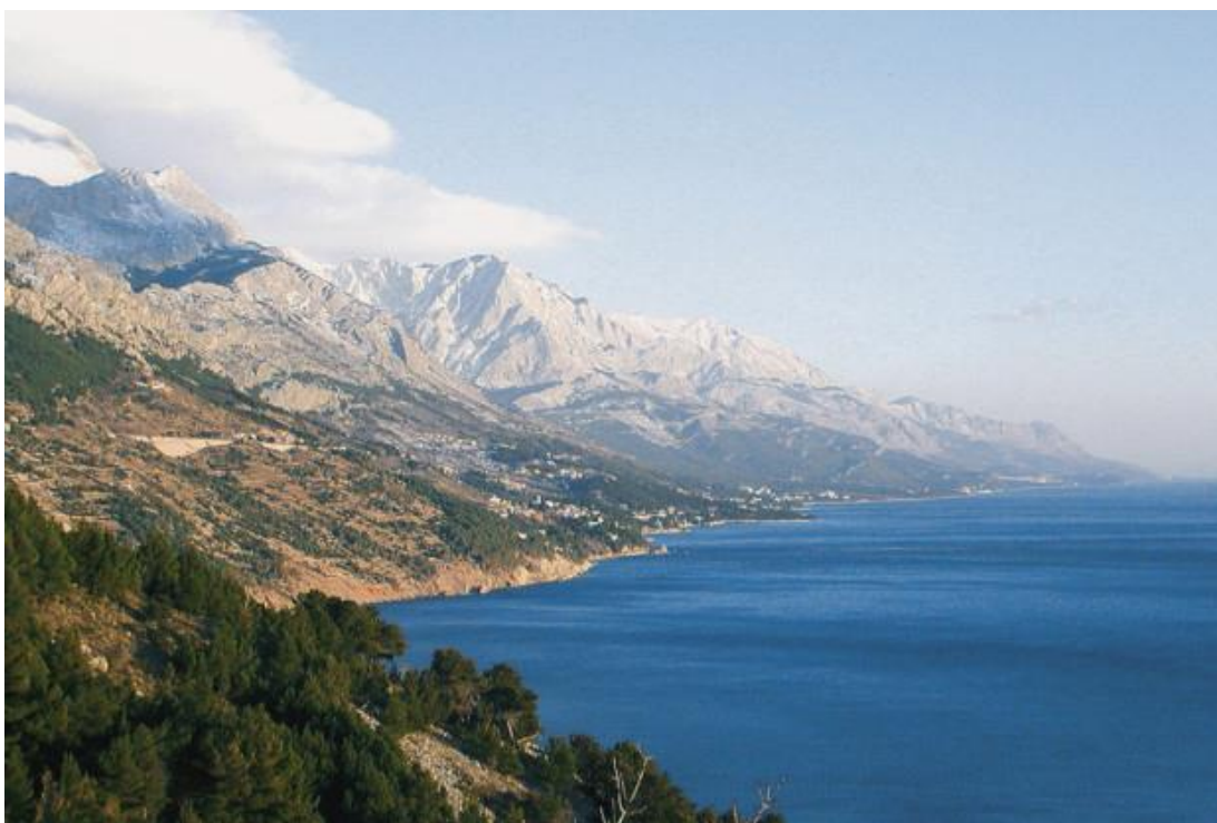
Slika 15. Biokovo.

Biokovo (Slika 15.) je dio planinskog masiva Dinarida i kao takvo ima smjer pružanja SZ-JI. Podnožje središnjeg dijela Biokova je blago nagnuta zaravan, koja se od mora izdiže do visine od oko 300 m, a uzevši u obzir da je oblikovana pretežito u fliškim naslagama, plodna je i zelena. Primorska strana Biokova strmo se ruši prema moru. Povrh tih stijena pruža se regija koja ima oblik valovite visoravni, široka je 3-4 km, karakterizira ju bogato razvijen krški reljef, a prema zaleđu se blago i postupno spušta. Od krških pojava i oblika, ovdje se susreću površinski oblici – egzogeni krš, te dubinski oblici – endogeni krš. Površinske krške oblike predstavljaju: grižine ili škrape, ponikve, uvale i okršene doline, a od endokrških formi oblikovane su brojne jame i špilje (duboke čak i do nekoliko stotina metara).