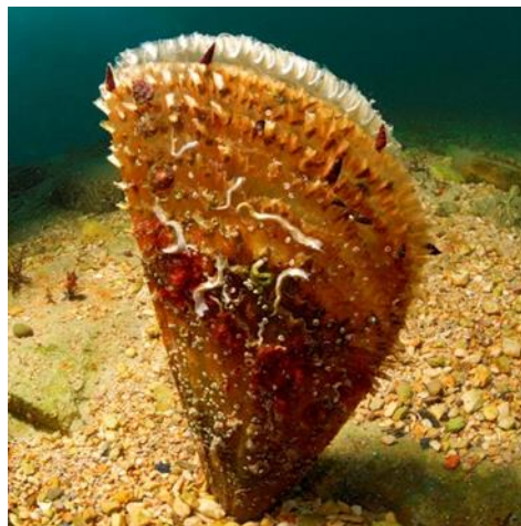
Slika 7. Plemenita periska.

Periska ( Pinna nobilis ) najveći je i najatraktivniji školjkaš koji živi u Jadranskom moru, a karakterističan je po obliku i građi. Vrsta je prvenstveno privlačna zbog svoje ljušture koja kao suvenir ima vrlo visoku cijenu. Oblikom podsjeća na izduženi trokut sa zaobljenom osnovicom i oštrim kutom. Ljuštura je tanka i krhka, a vanjski dio ljušture djeluje kao da je ukrašen mnogim ljuskastim lamelama. Boja ljušture s vanjske je strane crveno-smeđe-sedefasta, a s unutarnje opalno-sedefasta (Grubišić, 1988). Tijelo školjke naraste do jednoga metra, a najveće jedinke imaju masu i do 3 kilograma. Prosječni primjerci dugi su 30 do 50 centimetara i teški četrdesetak dekagrama. Periska (Slika 7.) je danas rijetka vrsta, ali još uvijek naseljena u čitavom Jadranu. Živi na dubinama od 2 do 20 metara, isključivo na mekom, pjeskovito-muljevitom dnu. Živi uspravno, svojim užim dijelom zabodena je u meku podlogu, a čvrstim svilenkastim bisusnim nitima pričvršćena je za dno. Nalazi se u zaštićenim zaljevima i uvalama (Butler, Vicente i De Gaulejac, 1993). U Jadranu je vrsta jako prorijeđena, pa je uvrštena u ugrožene životinjske vrste i zakonom je zaštićena, a njeno vađenje je strogo zabranjeno. Na nekoliko lokacija još postoje njena nešto brojnija naselja, dok se drugdje nailazi na rijetke primjerke. Oni koji vade perisku čine to prvenstveno zbog njene ljušture, a ne zbog vrijednosti njena mesa.