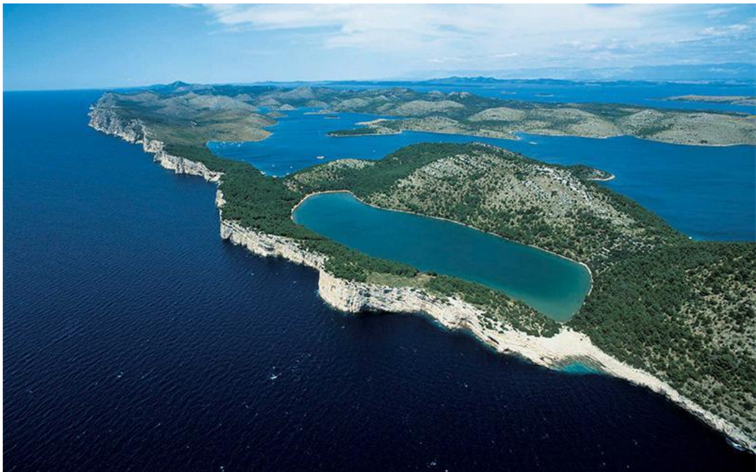
Slika 13. PP Telašćica.

Na ovom području ističu se tri fenomena (Slika 13.): jedinstvena uvala Telašćica kao najljepša i najveća prirodna luka u Jadranskom moru, strnci Dugog otoka, tzv. „stene“ (uzdižu se do 161 m iznad mora te se spuštaju u dubinu od 90 m), te slano jezero Mir poznato po svojim ljekovitim svojstvima.