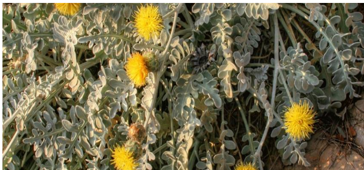
Slika 4. Dubrovačka zečina.