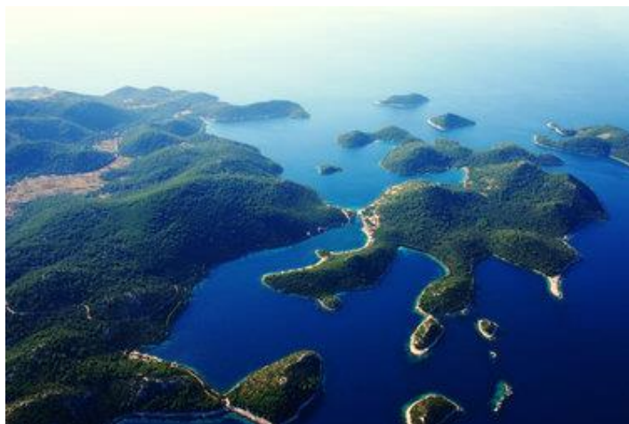
Slika 16. PP Lastovsko otočje.

Park prirode Lastovsko otočje (Slika 16.) obuhvaća 44 otoka, otočića, hridi i grebena (najveći od njih su Lastovo i Sušac) ukupne kopnene površine od 53 km 2 te 143 km 2 morske površine. Dobio je ime po najvećem otoku u arhipelagu – Lastovu. Lastovo i okolni otoci nastali su taloženjem skeleta i kućica morskih organizama i to je razlog za nastajanje dolomitno-vapnenačkog tla te brojnih špilja, jama i polja.. Lastovo je brdovit otok s pedesetak plodnih polja. Za razliku od ostalih krških polja, lastovska su puna pijeska i lapora koje je nanosio vjetar. Biološki je to jedan od najočuvanijih prostora na Sredozemlju. Svjetska organizacija za zaštitu prirode (WWF) otok je proglasila prostorom od posebne važnosti za očuvanje ukupne bioraznolikosti Sredozemlja. „Ova opažanja povećavaju vrijednost istraživanog područja kao „prirodnog laboratorija“ za buduća istraživanja ekologije i evolucije otočkih populacija“ (Vervust, Grbac, Brecko, Tvrtković i Van Damme, 2009, str. 114).