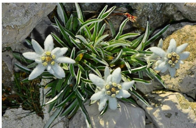
Slika 3. Runolist.