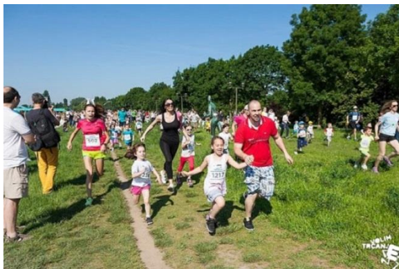
Slika 12 Zajednička obiteljska rekreacija

Primarna razina prevencije pretilosti usmjerena je populaciju, kako bi se informiralo o značaju pretilosti za zdravlje. Programi primarne prevencije su usmjereni prema trudnicama, djeci i adolescentima.. Strukture nacionalne, regionalne i lokalne vlasti svojim zanimanjem, financijskom potporom i razumijevanjem važni su u provođenju tih programa. Dobri primjeri su: dostupnost sportskih terena i plivališta. izgradnja biciklističkih i pješačkih staza, te ostalog za dječju rekreaciju.