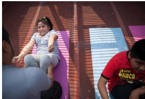
Slika 10 Pretila devetogodišnja djevojčica pri izvođenju tjelesne aktivnosti

Većinu djece koja je pretila, potrebno je poticati u održavanju vlastite tjelesne težine, tako da je izrastu, rastom u visinu. Nikako ih ne treba stavljati na redukcijsku dijetu bez medicinskog nadzora, jer se može ugroziti djetetov rast. U dobi od prve do pete godine starosti uz dijetetski pristup potrebno je poticati tjelesnu aktivnost djeteta primjerenu mogućnostima. Naglasak je na vježbanju, a ne na dijeti (Bralić, I., 2014.).