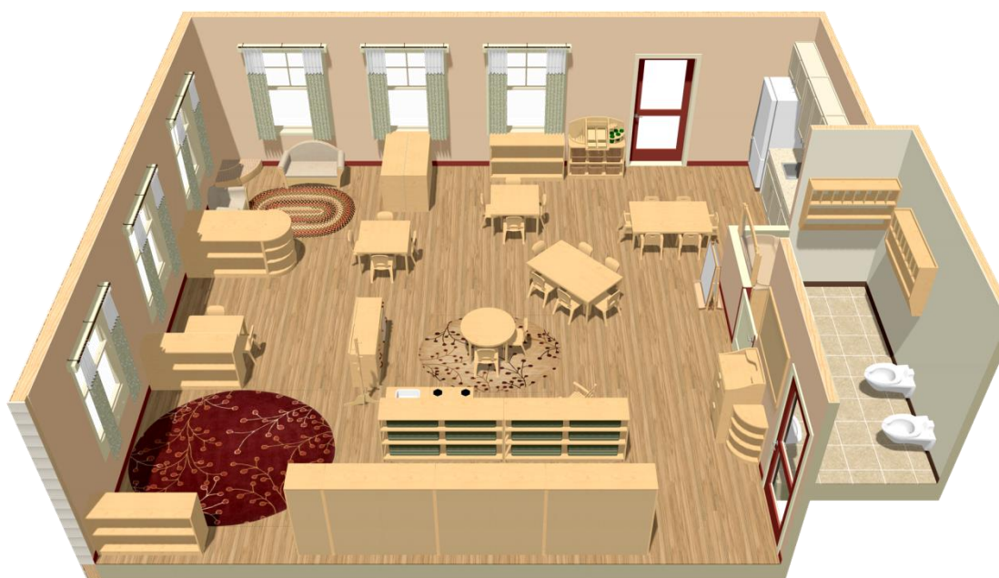
Slika 2 Primjer izgleda Montessori sobe za djecu od 0 do 3 godine

Važno pravilo u Montessori prostoru je vratiti materijal na isto mjesto gdje se on prvobitno nalazio i u istom stanju.