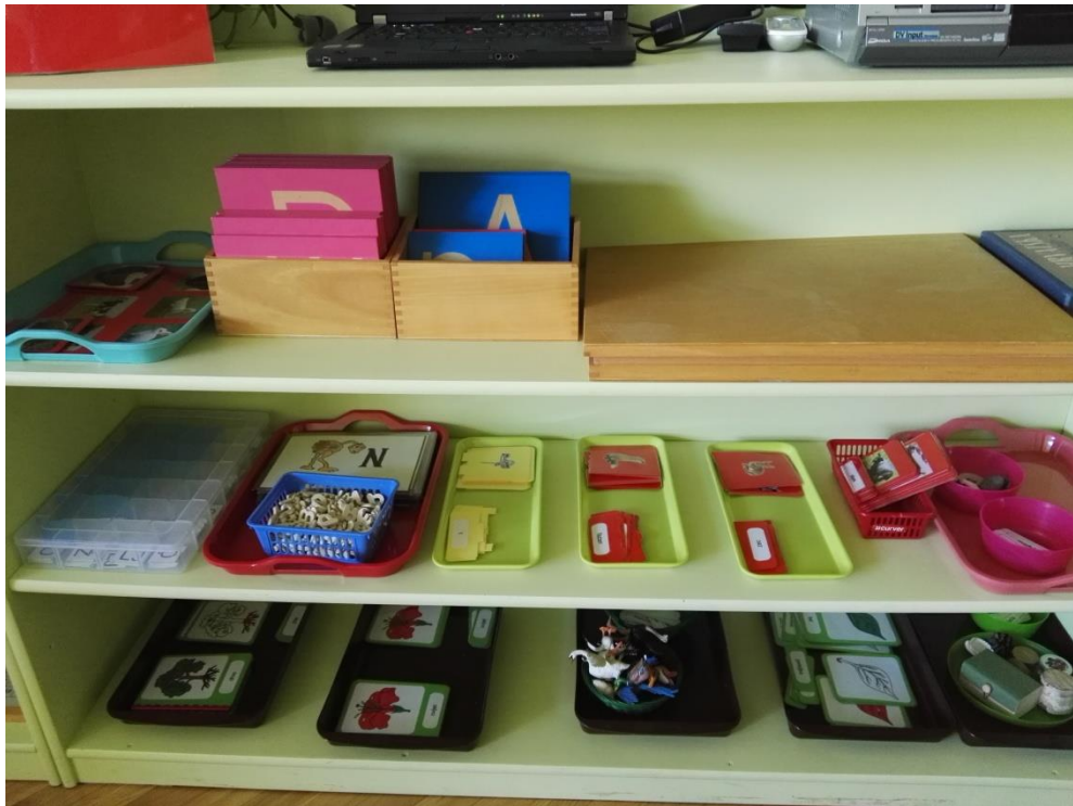
Slika 6 Primjer vježbi za poticanje govora i usvajanje jezika