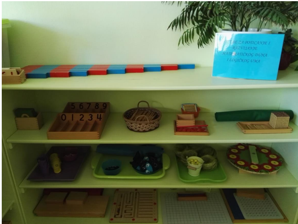
Slika 7 Primjer vježbi za poticanje i razvijanje matematičkog duha i logičkog uma