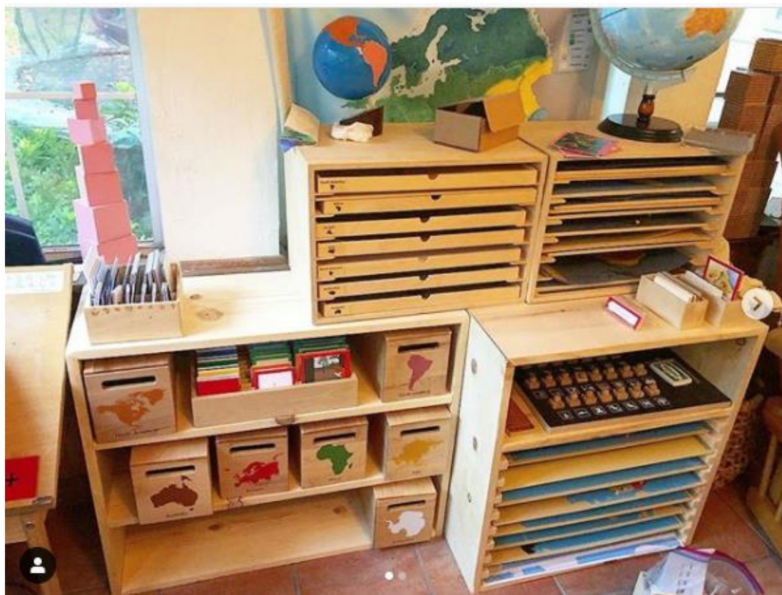
Slika 8 Primjer vježbi kozmičkog odgoja