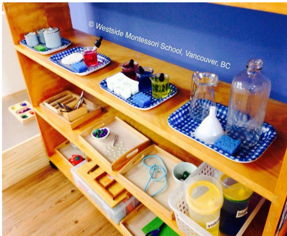
Slika 4 Primjer vježbi za poticanje samostalnosti u svakodnevnom životu