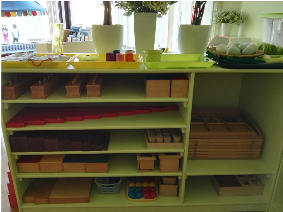
Slika 5 Primjer vježbi za poticanje osjetilnosti