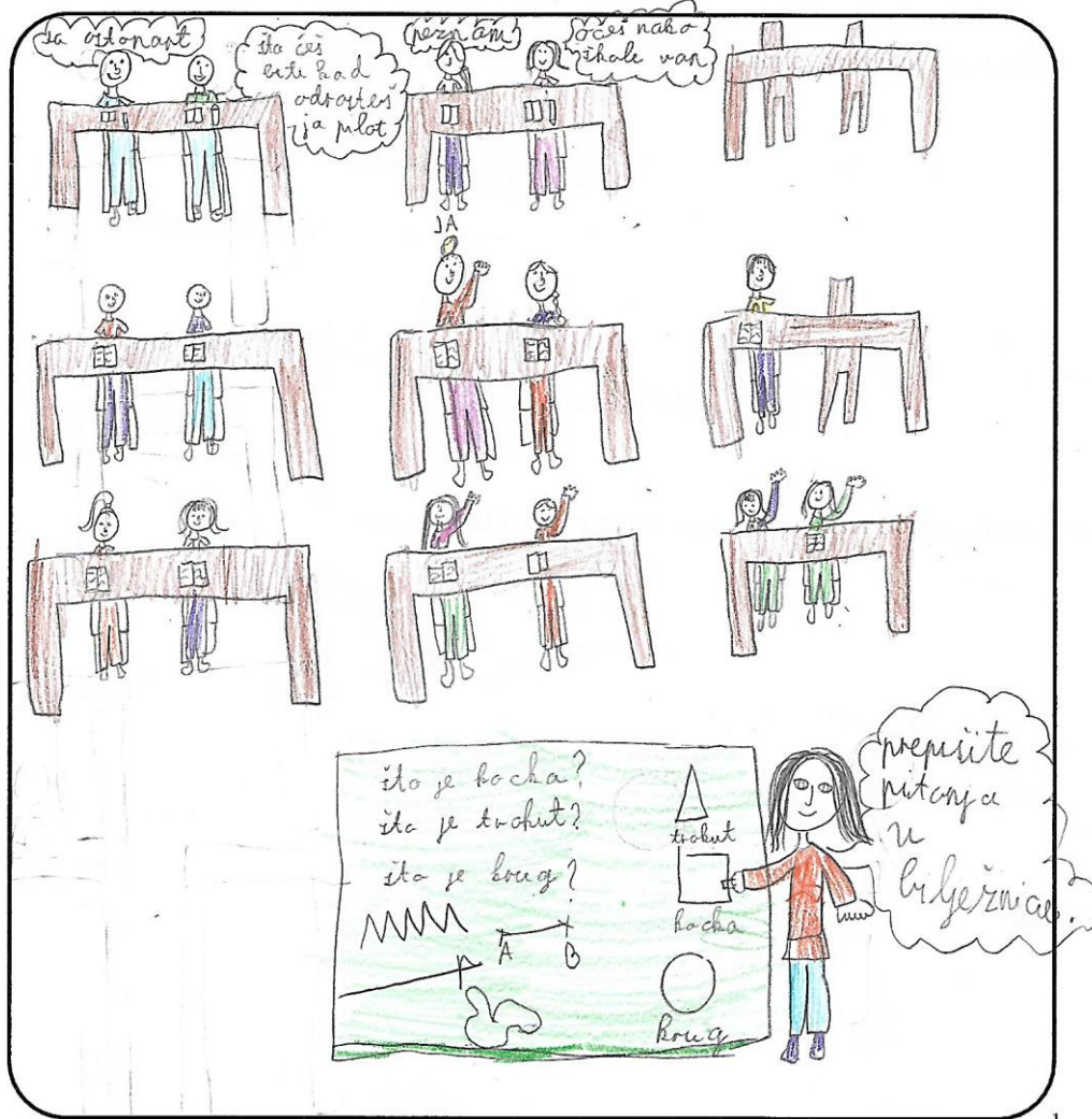
Slika 2. Učnički prikaz tipičnog sata geometrije u 3. razredu