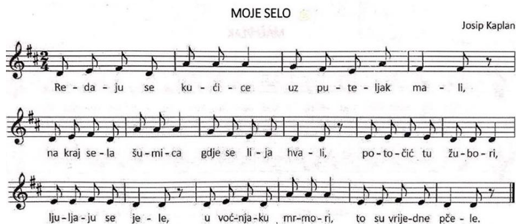
Slika 1: Pjesma "Moje selo" (Kraljić, 2017.)