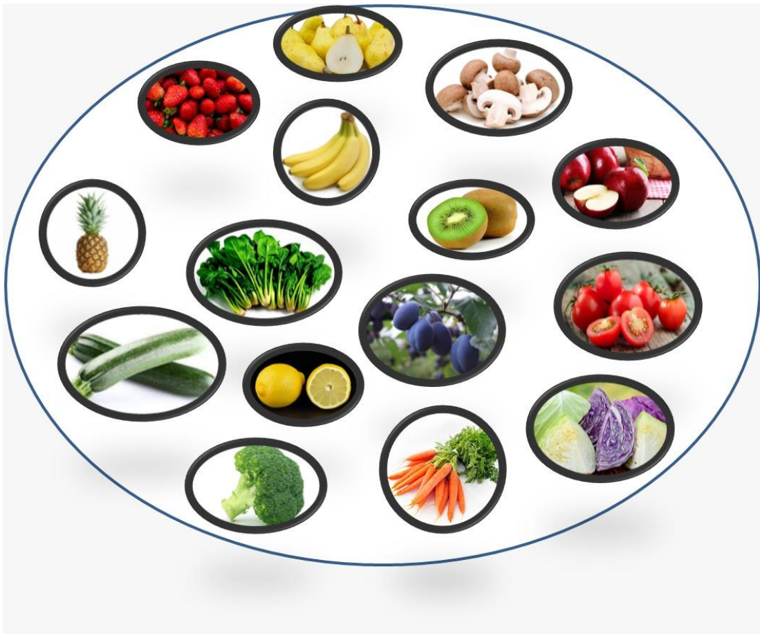
Slika 2. Zdrave namirnice

dječji rast i razvoj. Ona djeca koja prestaju jesti kada osjećaju da su siti, imaju veće šanse da jednog dana neće biti pretili. Znamo da nije lako dijete predškolske dobi maknuti od sokova i ostalih nezdravih tekućina, pa ako već dijete konzumira takve proizvode, dobro bi bilo znati koliko dnevno smije unijeti u svoj organizam, a da se pridržava nekih osnovnih nutrijenata. Dnevni unos voćnog soka u organizam trebao bi količinski obuhvatiti jednu šalicu, čaj, juha i sok od povrća jedna i pol šalica na dan, mlijeka bi trebali unijeti od dvije do tri šalice na dan isto kao i vode. Često se zapitamo je li naše dijete doista gladno ili jede zato jer se javljaju neki drugi osjećaji kao što su tuga, osjećaj usamljenosti, dosada. Ako povežemo osjećaj tuge sa glađu, ta će se veza teško prekinuti, i svaki puta kada će dijete biti tužno, ono će posezati za hranom. Djetetova tjelesna masa znatno će se povećavati, a osjećaj tuge i dalje će biti prisutan, a da se ustvari neće znati pravi razlog zbog kojeg dolazi do toga. Predškolsko dijete na dan jede tri obroka i dvije užine, pa će tako roditelj pokušati te obroke obogatiti sa što više hranjivih tvari.