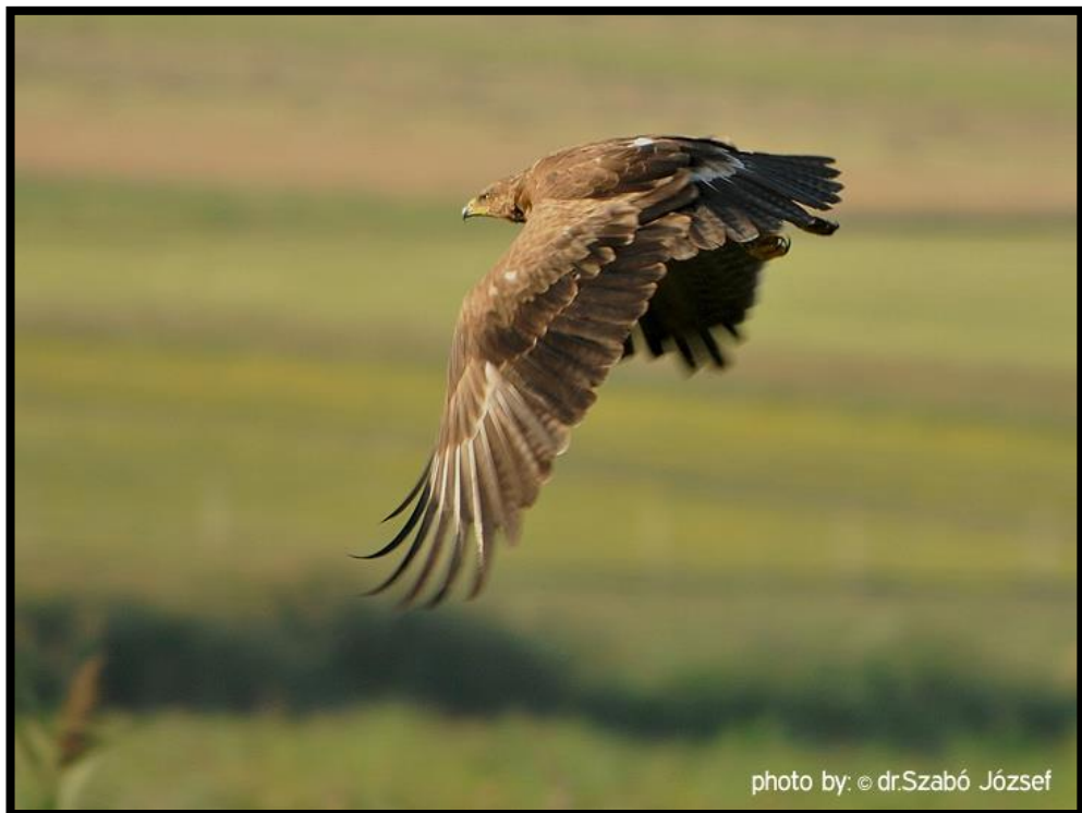
Slika 12. Orola Kliktaš u lovu