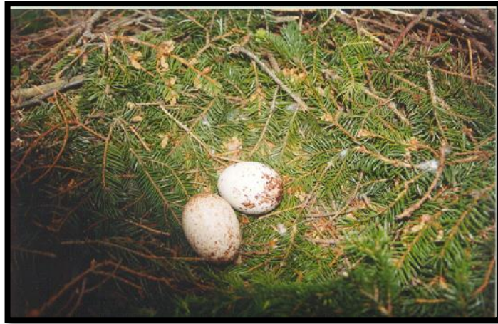
Slika 11. Gnijezdo Orla Kliktaša