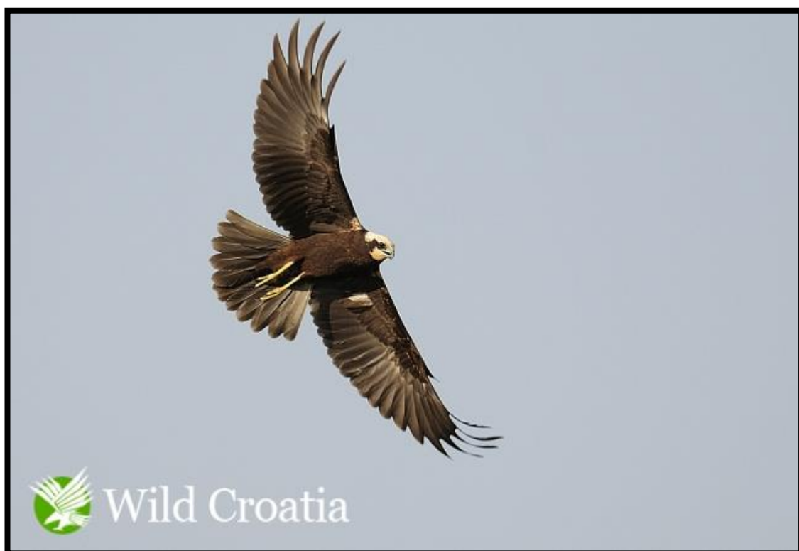
Slika 15. Eja močvarica

Eja močvarica ( Circus aeruginosus Linnaeus, 1758) je jedna od većih ptica grabljivica, zbog čega se i hrani čitavim nizom ranih organizama: manjim pticama, ribama, patkama, miševima, krticama, štakorima pa čak i manjim lisicama. Tijekom sezone razmnožavanja područje lova ove vrste je smanjeno te je njena prehrana usmjerena na močvarne ptice i male sisavce koje je lako uhvatiti. Eja močvarica lovi iz zasjede i ne oslanja se na brzinu.