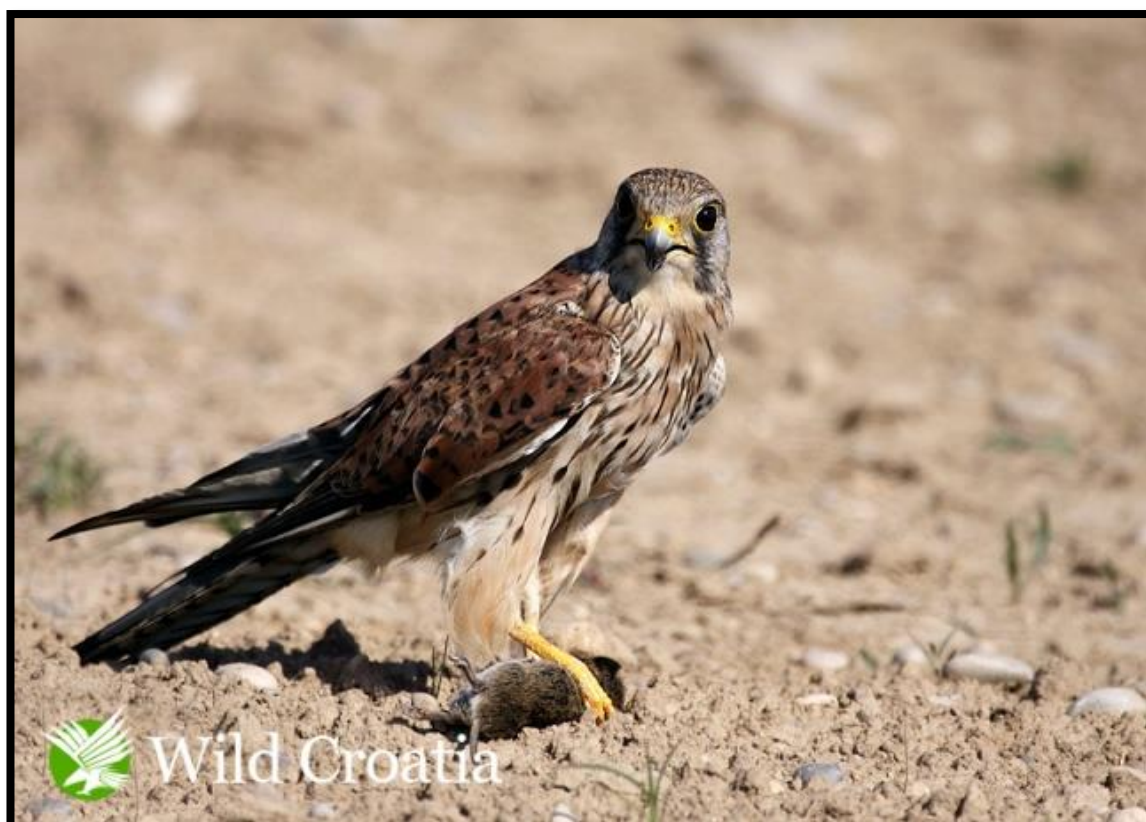
Slika 18. Vjetruša

Vjetruša ( Falco tinnunculus Linnaeus 1758) grabljivica crvenosmeđe boje s crnim pjegama pripada porodici sokolova. Mužjak je sive glave i crvenosmeđih leđa s nešto tamnih mrlja na truhu, dok ženka ima tamnija leđa. Jedna je od najrasprostranjenih vrsta ptica u Hrvatskoj. (Park prirode Lonjsko polje http://www.pp-lonjsko-polje.hr/ )