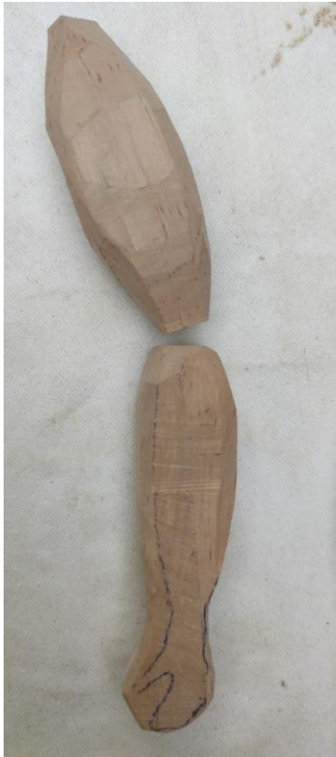
Fotografija 14. (vlastiti izvor) Fotografija 15. (vlastiti izvor) Fotografija 16. (vlastiti izvor)