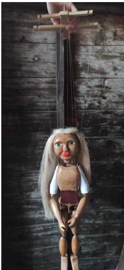
Fotografija 23.