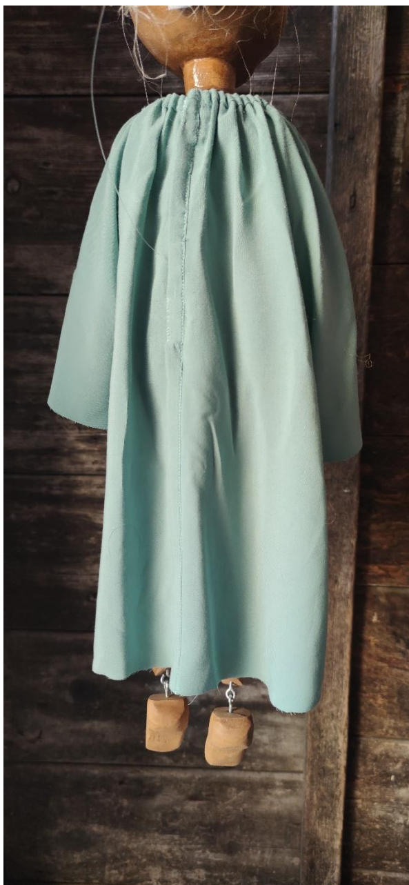
Fotografija 25.