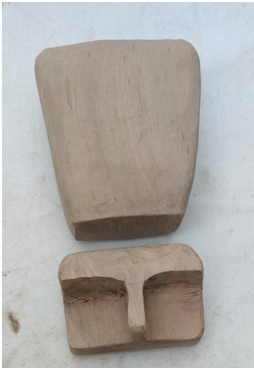
Fotografija 10.