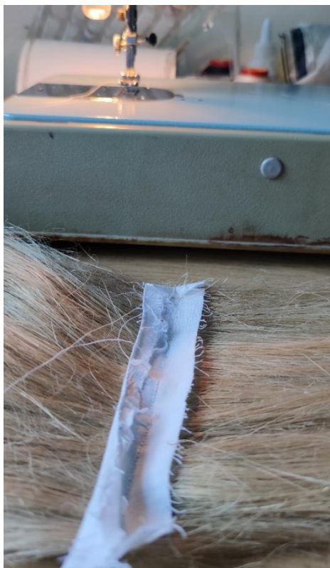
Fotografija 17