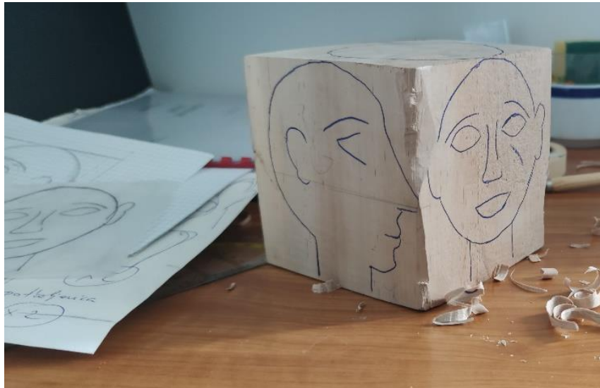
Fotografija 7.

Dimenzije komada drveta prije obrade su 10 x 10 x 7 centimetara. Prilikom izrade glave kocka drva se stavlja u škripu te se dlijetom skida višak. Na taj način iz drvene kocke izranja na površinu izranja reljef lica. Potrebno je paziti na najvišu točku kada lice gledamo sprijeda (nos) te uzeti u obzir kako skidamo drvo. Vrlo je važno obratiti pažnju na godove i na tok drva kako ne bi došlo do pucanja. Periodično glavu izvadimo iz škrice i olovkom označimo mjesta na kojima je potrebno skinuti još drva. Veće površine skidamo dlijetom, oblikujemo rašpom te na kraju obrađujemo dremelom.