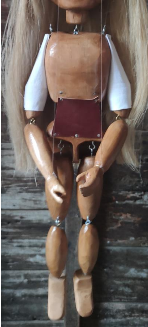
Fotografija 20.