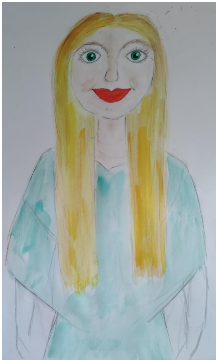
Fotografija 5.

Inspiracija za lik lutke je „Zora“, boginja praskozorja i povečerja. Prema slavenskoj mitologiji ona svako jutro otvara nebeska vrata za izlazak Sunca te ih svaku večer u suton zatvara. Ujedno predstavlja i božicu trojdnosti pri čemu predstavlja jutro, večer i noć ili djevicu, majku i staricu. Vlastita interpretacija Zore predstavlja boginju u svitanje, dok je jutarnja rosa na travnjacima, ona izranja zajedno sa Suncem. Plava kosa predstavlja zajedničko rađanje sa Suncem, zelene oči i haljina jedinstvo sa prirodom, a crvene usne i puni obrazi mladost i čednost (Spirin, 1997).