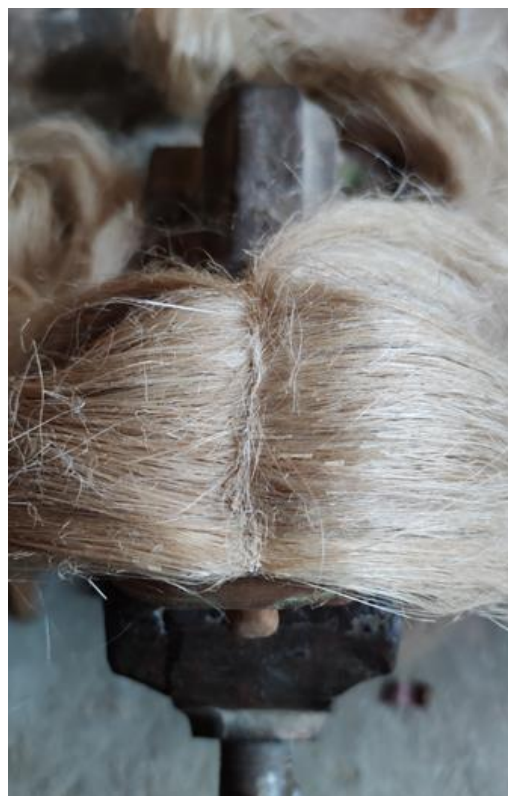
Fotografija 18.