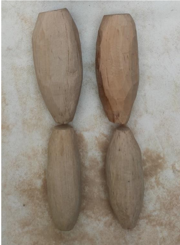
Fotografija 12.