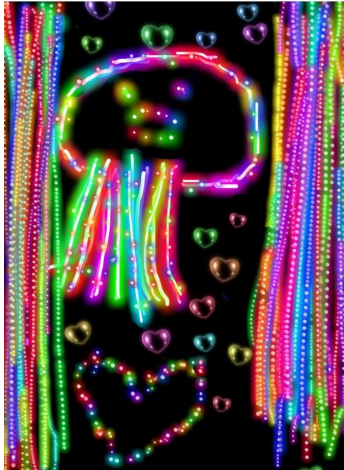
Slika 4 „Šarena meduza“, računalni program „ KidsDoodle “ (Ban, 2017)

Radovi „Riba - pas“ (Slika 3) i „Šarena meduza“ (Slika 4) nastale su pod istim uvjetima kao i rad „Riba s krunom“ (Slika 2), ali je sada djetetu bila ponuđena nova tehnika - crtanje u računalnom programu tj. na tabletu. U radu „Šarena meduza“ (Slika 4) riba poprilično liči na hobotnicu ili meduzu. Ban (2017) uočava kako je dijete kroz korištenje raznih efekata, igrom boja i oblika izrazilo svoje osjećaje te je pokazalo interes za perspektivu, dubinu i izradilo pozadinu.