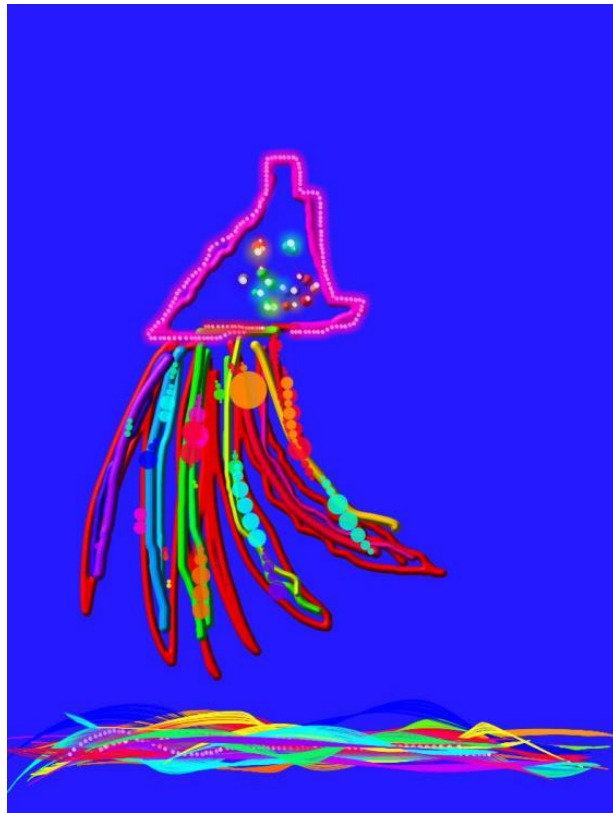
Slika 5 „Šarena riba iz mašte“, računalni program „ KidsDoodle “ (Ban, 2017)

Ban (2017) ukazuje kako u dječjem radu „Šarena riba iz mašte“ (slika 5) oblik ribe nije pretjerano kreativan jer prikazuje ribu koja je viđena u videu ali je zato raznim bojama i pokretima ilustriran pijesak koji je prikazan kako se giba dok riba pliva iznad njega.