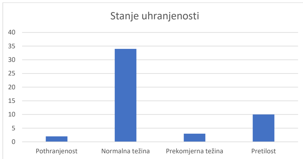
Graf 1 Stanje uhranjenosti dječaka i djevojčica u dobi od 5-7 godina

vrijednost manja od 0.05% (u ovom slučaju 0.03) što je utvrdilo značajniju razliku između ispitanih varijabli (Tablica 7).