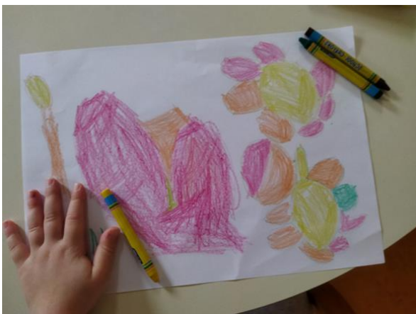
Slika 8. Cvijeće i srce – pastel (djevojčica, 3 godine)