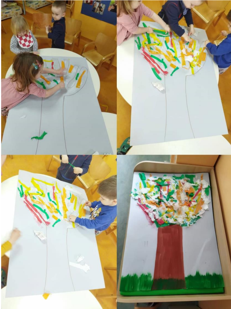
Slika 20. Kolaž traka i trgani papir – grupni rad