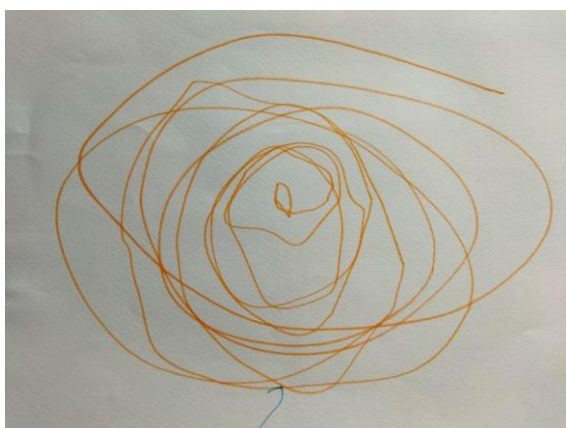
Slika 5. Krug – flomaster (dječak, 3 godine)

Dijete s tri godine već može vrlo spretno držati olovku i baratati njome, potpomažući si pridržavanjem papira drugom rukom. Tijekom crtanja možemo primijetiti da dijete pridaje više pažnje rasporedu onoga što crta, a čini to većim brojem raznolikih tragova. Prvi simbol koji se pojavljuje u ovoj fazi dječjeg crtanja jest krug (Belamarić, 1987).