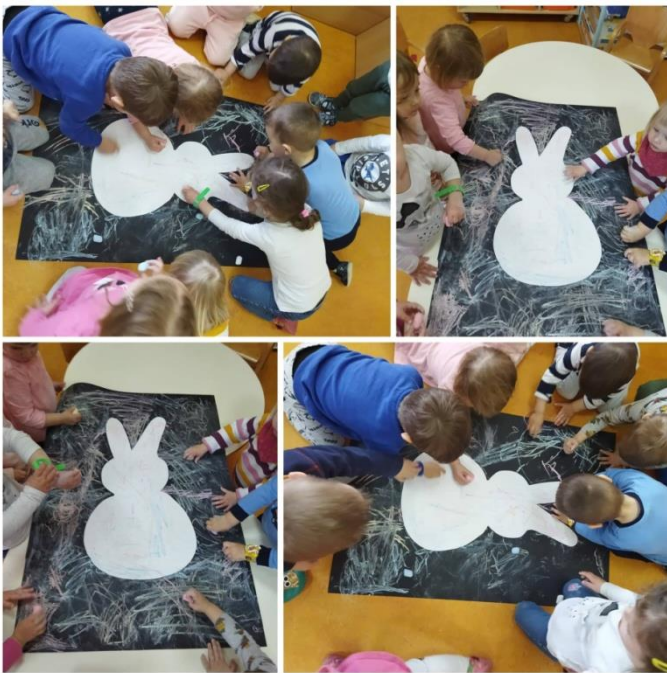
Slika 15. Zeko u kredi

tehnika je crtanje kredom. Potrebni materijali za izvođenje aktivnosti jesu: papir u crnoj boji i kreda. Površina koja je trebala predstavljati oblik zeca bila je prekrivena, a djeca su ispunjavala okolni prostor na plakatu. Likovnoj aktivnosti prethodila je priča: „Lupko je pronašao jaje“ naklade EGMONT. Kreda je omiljena tehnika ove jasličke skupine, a djeca su ovdje imala priliku po prvi puta istu upotrijebiti na papiru na način popunjavanja površine tonovima. Odaziv djece bio je velik, a aktivnost im je bila zanimljiva, kredu su me tražili i prilikom boravka na zraku. U idućoj izvedbi ove aktivnosti svakom bih ponudila vlastiti papir kako bi individualno uživali u tehnici crtanja kredom.