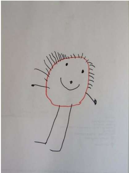
Slika 6. Moj braco – flomaster

čovjeka. Dijete ne pokušava stvoriti kopiju čovjeka već se za prikaz koristi jednostavnim oblicima i linijama (Belamarić, 1987). Obično to bude glava (nakupina krugova) s nogama (ravne linije).