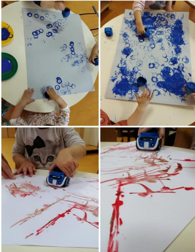
Slika 13. Slikanje autićima i kockicama