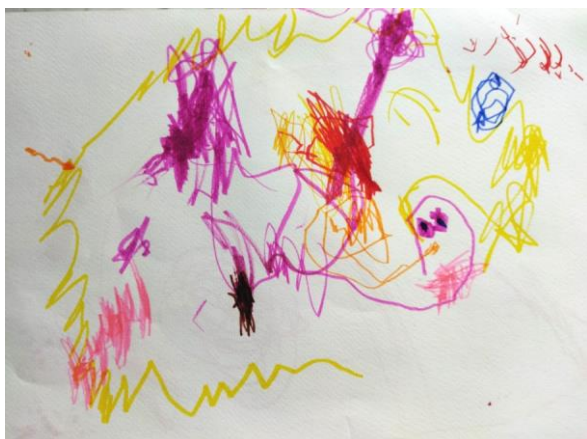
Slika 4. Crtež – flomaster (dječak, 3 godine)

Pojava slučajnog crteža pomaže u razvoju kontroliranih pokreta olovke koji se počinju javljati tek oko treće godine djeteta. Oko treće godine djeca počinju imenovati svoje crteže koji se još uvijek čine kao neuređen skup jednostavnih linija i simbola, ali počinju se nazirati tragovi ideje. (Belamarić, 1987) Imenovanje svojih likovnih djela važno je za razvoj mišljenja kod djeteta. Crtež uglavnom započinje spontano, no spontano nastale linije i oblici daju ideju djetetu za razvoj novog likovnog uratka.