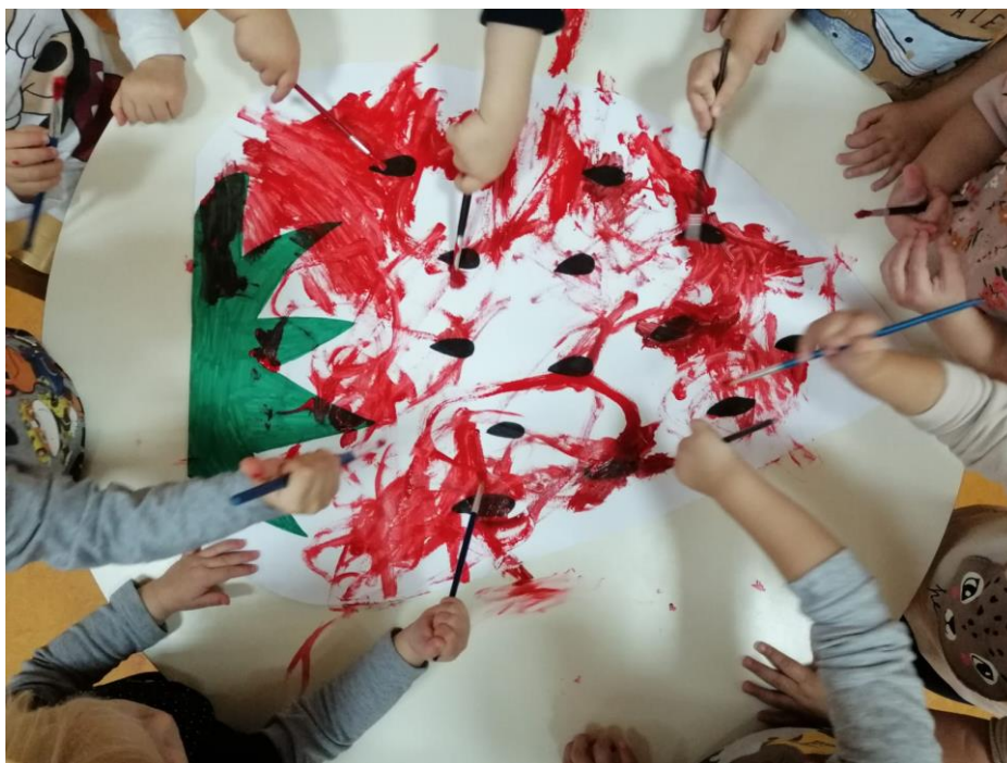
Slika 2. Timski rad – oslikavanje jagode