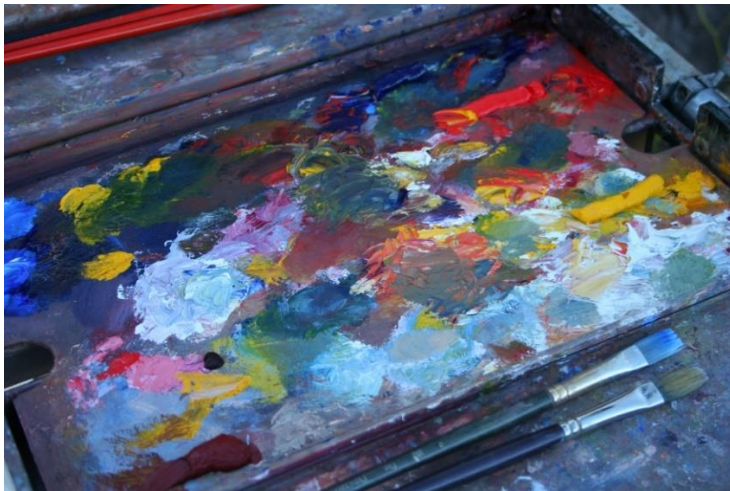
Slika 9. Tempere u drvenoj paleti i kistovi za tempere

Tempera je tehnika slikanja posebnim bojama koje se razrjeđuju vodom. Mješanje boja aktivnost je koja prethodi slikanju (Višnjić Jevtić, 2010). Boje su napravljene od mrvljenih pigmenata dobivenih od različitih ljepljivih tvari. Tempere su boje topive u vodi do trenutka sušenja na papiru. Jednom kad se osuše, više se ne tope u vodi. To svojstvo omogućava slojevito nanošenje boje i veliku raznolikost likovnog izraza ovom tehnikom. Temperom se može slikati na raznim podlogama poput papira, platna, drveta ili stakla zbog njenog dobrog prijanjanja. Tonovi tempere na podlozi su bez sjaja i nisu nijansirani pa je poželjno sliku nakon sušenja boje, premazati uljem što ju ujedno i čuva. Svojstva tempere i jednostavnost korištenja čine ju tehnikom dječjeg istaživanja kombinacija i miješanja boja. Za slikanje temperom pogodni su tvrdi glatki ili nešto hrapaviji papiri (Jakubin, 1999).