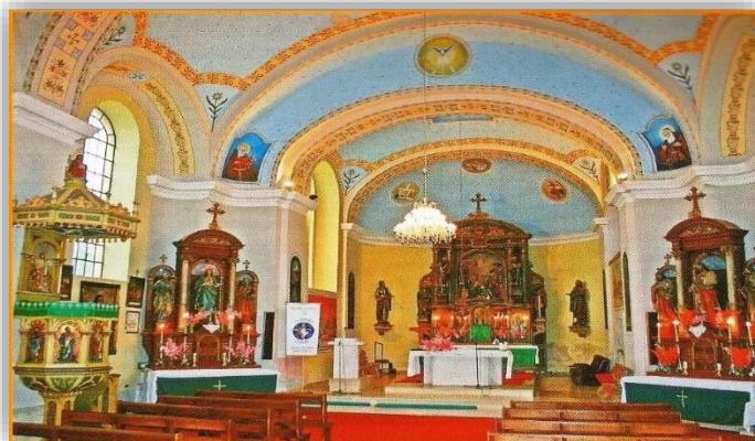
Slika 2. Unutrašnjost župe Gola

Ovi povijesni događaji ilustriraju proces formiranja i razvoja župnih struktura te duhovnog života u Goli i Ždali tijekom 19. stoljeća. Gradnja zidane župne crkve započela je 1839. godine, a 10. svibnja 1840. postavljen je blagoslovljen kamen temeljac (Večenaj, 1994). U 1842. godini izgrađen je toranj crkve, te je crkva ožbukana iznutra i izvana, dok su obnovljene orgulje prenesene iz stare kapele.