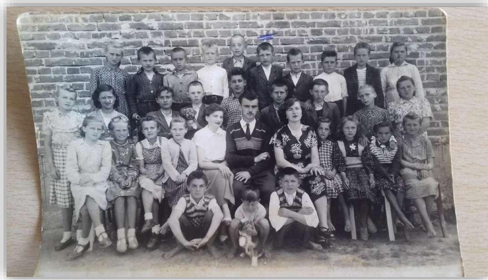
Slika 3. Fotografija generacije iz 1945. godine škola Gola