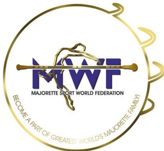
Slika 4. Grb MWF-a

Ostale velike svjetske mažoret asocijacije su International Federation od Majorette Sport (IFMS), World Baton Twirling Federation (WBTF) i United States Twirling Association (USTA) (SMPH, 2016).