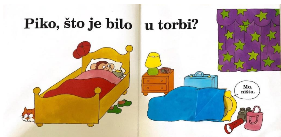
Slika 4. Piko kod prijatelja