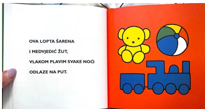
Slika 8. Miffy u kući