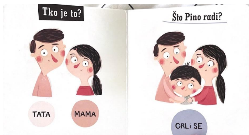
Slika 6. Što Pino radi?