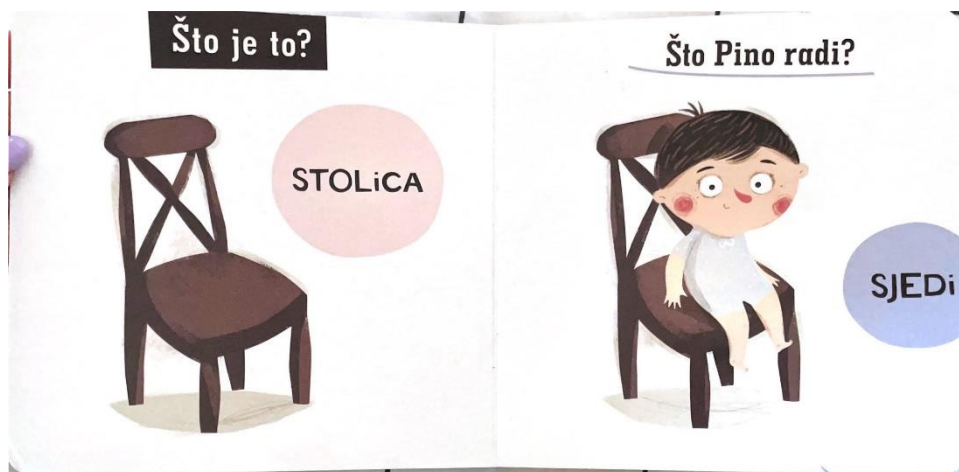
Slika 5. Što Pino radi? (preuzeto iz slikovnice)

Slikovnica je namjenjena djeci od 0 + godina. Slikovnica je napisana u stripovskom stilu. Tekst prati ilustracije i napisan je u upitnom obliku isto kao i slikovnica Piko kod prijatelja kako bi poticala djecu na razgovor s odraslom osobom s kojom čita. Ilustracije su prikazane u crtačkim tehnikama s kombinacijama linije, boja i sijena.