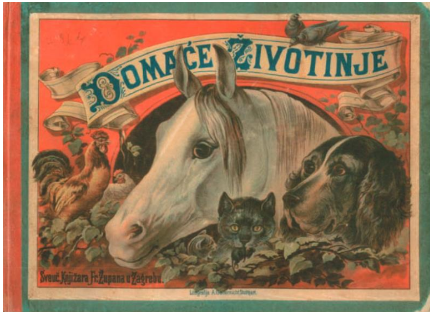
Slika 2. Naslovna stranica slikovnice Domaće životinje ( https://hrcak.srce.hr/file/214217 )

Isti autor navodi kako je prvi hrvatski ilustrator dječje knjige Nikola Lauppert, koji je 1844. godine ilustrirao „Basne“ autora Ignjata Čivića Rohrskog (Majhut, 2013). Knjižara „Mučnjak i Senfleben“, godine 1800., nudi razne slikovnice s naslovima: „Priča o pepeljugi“, „Priča o obuvenom mačku“ i sl.