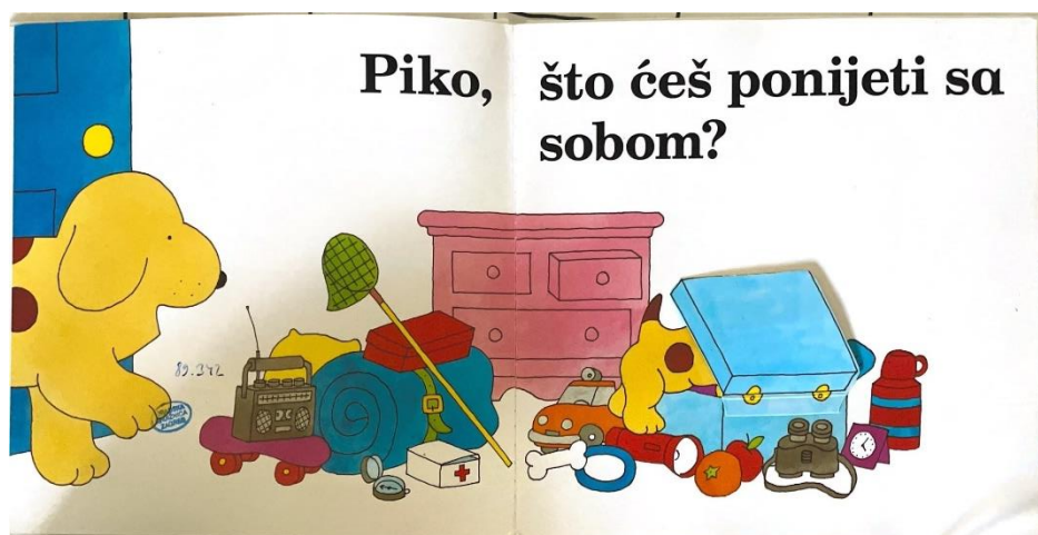
Slika 3. Piko kod prijatelja ( preuzeto iz slikovnice)