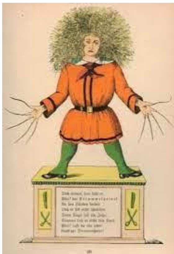
Slika 1. Struwwelpeter ( https://en.wikipedia.org/wiki/Struwwelpeter )

Francuski liječnik Heinrich Hoffmann napisao je slikovnicu „Struwwelpeter“ (Janko Raščupanko) koju je dao izraditi kao poklon svom trogodišnjem sinu za Božić te je time postala najpoznatija slikovnica 19.stoljeća. U prodaju je puštena 1845. godine pod nazivom „ Lustige Geschichten und drollige Bilder mit 15 kokrierten Tafeln für Kinder von 3 bis 6 Jahren “ ( „Vesele zgode i šaljive slike s 15 obojenih tabli za djecu od 3 do 6 godina“). Pod nazivom „Struwwelpeter“ izlazi 1847. godine (Batinić, Majhut, 2001). Autori Majhut i Batinić (2017) navode kako je slikovnica „Struwwelpeter“ u drugoj polovici 19.stoljeća postala medijem za prenošenje vrijednosti građanskog odgoja djece predškolske dobi te postala klasikom dječje književnosti zajedno sa slikovnicom Max i Moritz Wilhelm Buscha.