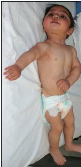
Slika 2. Dijete sa spastičnom kvadriplegijom

(https://theratogs.com/quadriplegic-cp/)