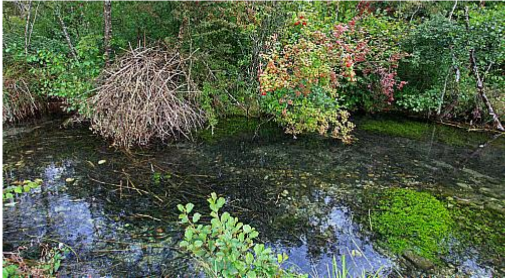
Slika 5. Stanište ljeti