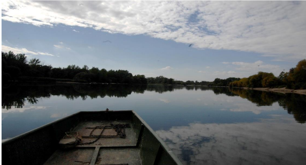
Slika 7. Stanište dabara na rijeci Dravi kod Preloga