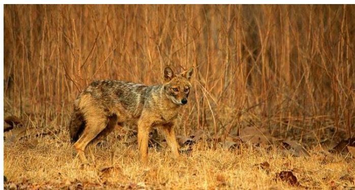
Slika 9. Čagalj ( Canis aureus L.)

Bokovi i bedra su svjetlije rumene do prljavo-žute boje, dok su trbuh i unutrašnje strane nogu svjetlije sivo-bijele boje (Tóth i sur., 2010). Boja krzna čagljeva koji obitavaju na području Hrvatske je najčešće smeđe-žuto-zlatna. U močvarnim i ravničarskim područjima je češće žuto-smeđa, dok je u primorskim i brdskim krajevima zlatno-žuta i smeđe-siva.