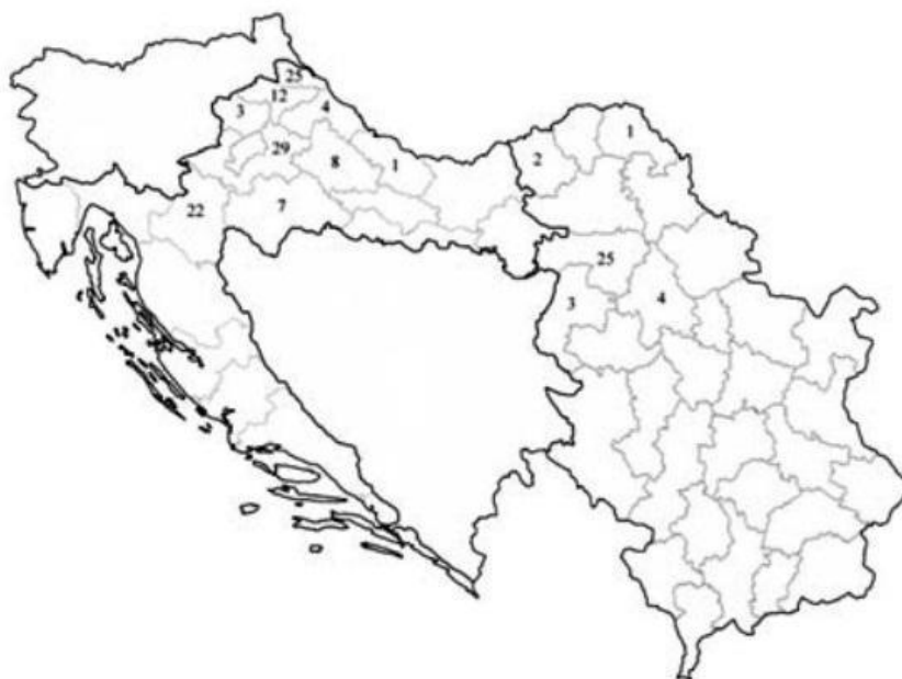
Slika 8. Prostorni raspored stradavanja dabrova u Hrvatskoj

U Hrvatskoj najveći broj stradavanja dogodio se u prometu i to 40 % . Nezakonitim lovom i ribolovom stradalo je 22 % . Jedna jedinka stradala je uslijed pada stabla. Udio lešina kod kojih nije mogao biti utvrđen razlog uginuća, najčešće zbog prekasnog dospijea na obdukciju iznosi 21 % . Što se tiče životne dobi uginulih dabrova, najviše su stradavale adultne jedinke, a zatim subadultne. Utvrđeno je da neznatno više stradavaju mušjaci. Najviše stradalih zabilježeno je u proljeće i jesen, a najmanje zimi (Cavrić, 2016).