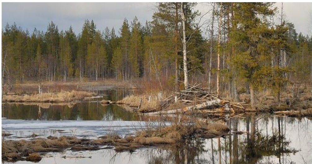
Slika 6. Stanište zimi