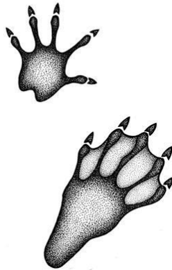
Slika 3. Otisci dabra

Dabar ostavlja brojne tragove po kojima se prepoznaje njegova nazočnost u pojedinom prostoru. Karakteristični tragovi su otisci nogu u blatu ili snijegu izlazne rupe, izlazni jarci na obalu, nagrižena i porušena stabla nastambe iznad zemlje (humci i brane).