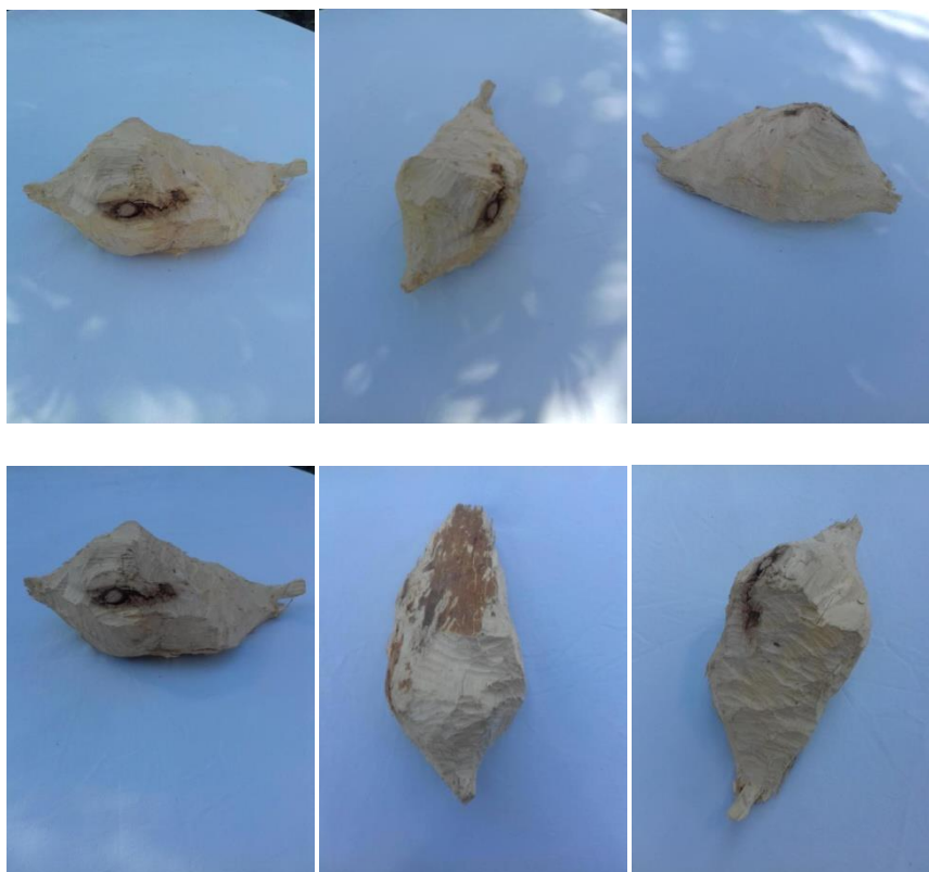
Slika 4. Izglodano stablo

(Izvor: osobna fotografija, slikano 13. 7. 2018. na Čabrajima - jezero u okolici Križevaca)