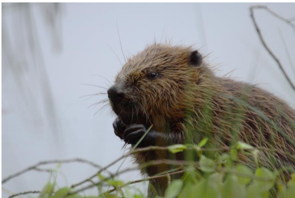
Slika 2. Europski dabar ( Castor fiber )