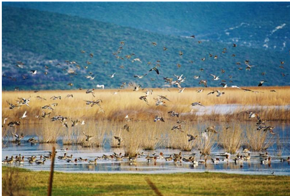
Slika 14. PP Vransko jezero stanište je brojnih ptica.

scrofa ), šumski miš ( Apodemus sylvaticus ), štakor selac ( Rattus norvegicus i zec ( Lepus europaeus ). Dalmatinski krški puh ( Eliomys quercinus dalmaticus ) i primorski dugouhi šišmiš ( Plecotus kolombatovici su endemične svojte Dalmacije ( http://www.pp-vransko-jezero.hr/hr/ ). Na jezeru je zabilježen i velik broj kukaca. U Parku su nađene 133 vrste pauka, od čega je čak 15 vrsta po prvi puta zabilježeno u Hrvatskoj (Mrakovčić, Mišetić, Plenković-Moraj, Grilca, Mihaljević, Čaleta, Mustafić, Kerovec, Pavlinić, Zanella, Buj, Brigić, Gligora i Kralj, 2004).