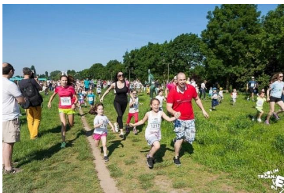
Slika 12 Zajednička obiteljska rekreacija

Primarna razina prevencije pretilosti usmjerena je populaciju, kako bi se informiralo o značaju pretilosti za zdravlje. Programi primarne prevencije su usmjereni prema trudnicama, djeci i adolescentima.. Strukture nacionalne, regionalne i lokalne vlasti svojim zanimanjem, financijskom potporom i razumijevanjem važni su u provođenju tih programa. Dobri primjeri su: dostupnost sportskih terena i plivališta. izgradnja biciklističkih i pješačkih staza, te ostalog za dječju rekreaciju.