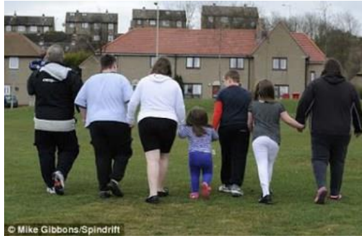
Slika 9 Pretila obitelj

https://theyouthofhealth.wordpress.com/2013/05/12/inside-the-life-of-an-obese-child-2/