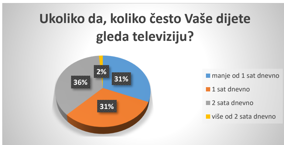
Slika 2. Učestalost gledanja televizije kod djece

Prema rezultatima istraživanja 31% djece televiziju gleda manje od 1 sat dnevno, isto tako 31% 1 sat dnevno, najveći broj djece (36%) televiziju gleda 2 sata dnevno, a 2% djece televiziju gleda više od 2 sata dnevno. Većina roditelja (85%) djece koja gledaju televiziju u potpunosti kontrolira sadržaj koji djeca gledaju, 15% samo djelomično kontrolira sadržaj, a niti jedan ispitanik ne dozvoljava djeci da samostalno bira sadržaj koji će gledati na televiziji.