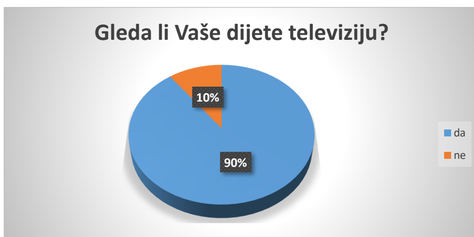
Slika 1. Navika gledanja televizije kod djece

U istraživanju je sudjelovalo 56% muške i 44% ženske djece rane i predškolske dobi, od čega je 8% u dobnoj skupini od 0 do 11 mjeseci, 33% u dobnoj skupini od 1 do 2 godine, 25% u dobnoj skupini od 3 do 4 godine, te 34% djece u dobnoj skupini od 5 do 6 godina.