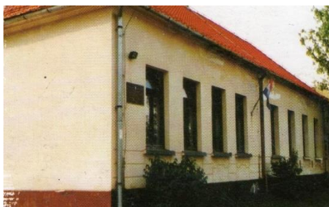
Slika 5 Područna škola Prigorec nekad

(Osobni arhiv, naslovnica razredne fotografije 2004./2005.)