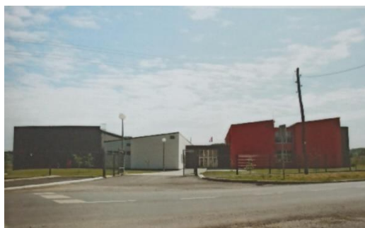
Slika 2 Nova Područna škola Tin Ujević, Salinovec