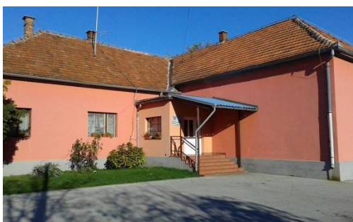
Slika 6 Područna škola Prigorec danas