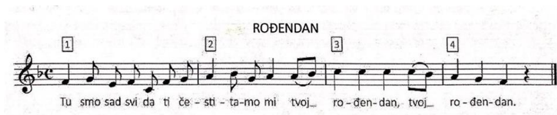
Slika 5: Pjesma "Rođendan" (Kraljić, 2017.)