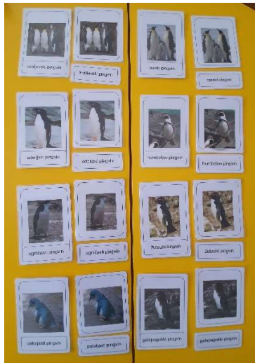
Slika 10. Životinje Antarktike