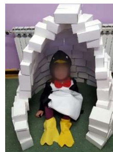
Slika 17. Simbolička igra