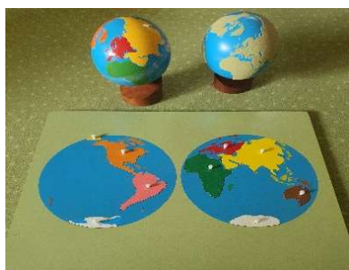
Slika 2. Globusi i puzzle svijeta