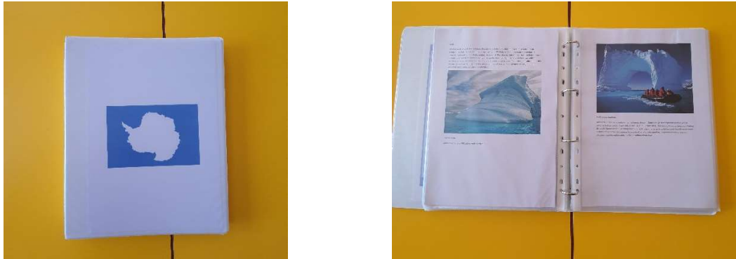
Slika 14. Album Antarktika