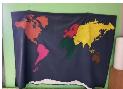
Slika 3. Karta svijeta

U sobi dnevnog boravka na zidu se nalazi naslikana karta svijeta (slika 3) na kojoj su kontinenti označeni istim bojama kao na globusu i puzzli zemljovida (Sjeverna Amerika-narančasta, Južna Amerika-ružičasta, Europa- crvena, Azija- žuta, Australija- smeđa, Afrika-zelena te Antarktika bijele boje). Starija djeca u skupini zapamtila su imena kontinenata uz ponuđeni pribor, a mlađa uz pjesmu „ Kontinenti “.