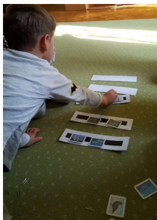
Slika 13. Hranidbeni lanac

odgojitelji su izradili kartice kako bi djeci približili hranidbeni lanac životinja na Antarktici. Djeca su fotografije životinja slagala u piramidu te na taj način usvajala čime se koja životinja hrani (slika 13). Svaka je fotografija na poledini imala magnet te se mogla pričvrstiti na magnetnu traku. Vježba je prezentirana u vrijeme zajedničke aktivnosti u „krugu“. Djeca su vizualno uspoređivala veličinu životinja i na taj način dolazila do zaključaka koja je životinja veća i može pojesti drugu, a čitanjem iz enciklopedije odgojitelj je potvrdio njihove zaključke.