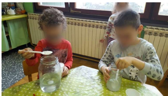
Slika 4. Miješanje soli i vode

Obzirom da je kontinent Antarktika zemlja leda i snijega, provedeni su pokusi u skladu s tim spoznajama. Promatrana su stanja vode u prirodi; tekuće, kruto i plinovito. U krutom stanju voda se može naći u obliku snijega i leda. Promatrano je koliki volumen posude zauzme voda kada je u tekućem stanju ili krutom. Potom je proveden pokus u kojem se promatrao proces kristalizacije. U suradnji s roditeljima, djeca su donijela staklenke. Svako je dijete napunilo svoju staklenku toplom vodom i dodavalo sol sve dok nije napravljena “zasićena otopina”. Djeci je bio posebno zanimljiv pojam, roditeljima su objašnjavali što je to i kako ona nastaje. Miješanjem i promatranjem postupka otapanja soli u vodi, djeca su postigla veliki stupanj koncentracije.