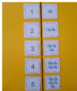
Slika 15. Sličice i brojke

Za djecu starije dobi prekinut je linearan slijed i otežana vježbu, kartice s lijeve strane tbile su pomiješane tako da se brojčane vrijednosti slože nasumce.