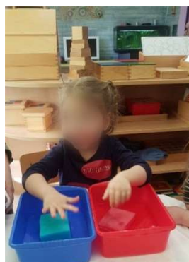
Slika 9. Taktilni osjet