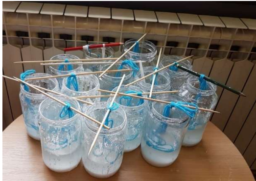
Slika 5. Završetak pokusa

Djeca su svakodnevno, samoinicijativno pratila promjene u staklenki i na niti vune koje su se događale koristeći povećalo. Predškolci su promjene bilježili crtežom svakih 5 dana, sve dok tekućina iz staklenke nije u potpunosti ishlapila. Crteži su na kraju ciklusa spojeni u knjižicu. Pojavljivala su se pitanja kod mlađe djece: „ Gdje je nestala voda? “. Stariji dječak odgovorio na slikovit način: “Pa vidiš kako je toplo blizu radijatora, voda je isparila. Kada polijemo majicu stavimo je na radijator da se osuši- tako se osušila i voda koja je bila u staklenci.“