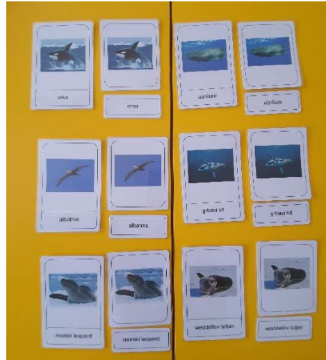
Slika 11. Vrste pingvina

Po završetku aktivnosti s karticama, djeca su izrađivala svoje knjižice sa životinjama Antarktike. Odgojitelji su pripremili predloške životinja koje su sva djeca trebala obojati, a oni koji znaju pisati, napisali su i naziv.