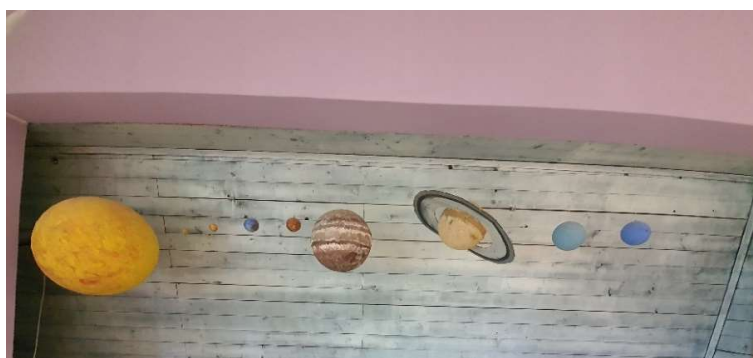
Slika 1. Sunčev sustav

Prije početka projekta „Antarktika“ djeca su putem priča, sadržaja iz enciklopedija, slikovnim i video predodžbama upoznata s nastankom Svemira na način prilagođen njihovoj razvojnoj dobi. Od Montessori pribora korištene su kartice za imenovanje, puzzle te kaširani planeti koji viseći sa stropa dnevnog boravka svakodnevno privlače interes djece. Djeca su usvojila nove spoznaje o tome što se u svemiru nalazi: planeti, meteori, zvijezde. Usvajanje novih pojmova o Sunčevom sustavu vodilo se u tri kategorije: „ po redu, obliku, bojama i veličini “.