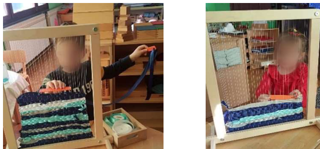
Slika 7. Okvir za tkanje

odgojitelj uveo djecu u aktivnost, udaljio se i nije ih dalje ometao. Aktivnost djevojčice i dječaka dugo je trajala, rad druge djece nije ometao njihovu koncentraciju. Po okončanju aktivnosti, djeca su svoj pribor vratila na mjesto na kojem su ga pronašli.