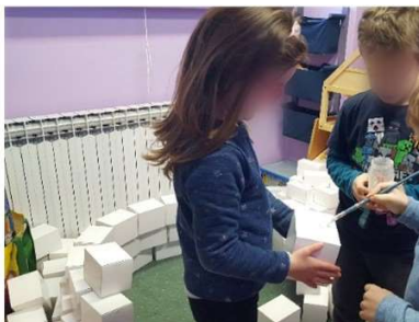
Slika 16. Zajedničko građenje iglua

Tijekom provedbe projekta, roditelji su pokazali veliki interes za isti te je ostvarena kvalitetna i produktivna obostrana suradnja. Roditelji su donirali mnogo malenih kartonskih kutija oblika kvadra. Kutije su korištene za izradu iglua. Svakodnevno pri dolasku u vrtić, djeca su se izmjenjivala u građenju čime su razvijali međusobnu suradnju, konstruktivno i zajedničko djelovanje u rješavanju problemskih situacija. Od početka gradnje djeca su međusobno dogovorila proces rada te podijelila uloge, npr. jedno je dijete slagalo kvadre, a drugo je nanosilo drvofix (slika 18). Mlađa su djeca pri završetku građenja donijela kostime pingvina te razvila simboličku igru u igluu (slika 19).