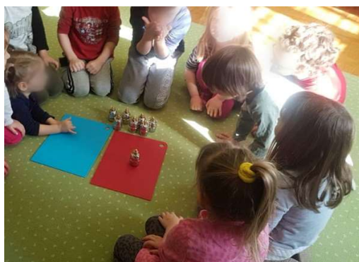
Slika 8. Zajednička aktivnost

Zadatak je odgojitelja bio pripremiti sredstva za rad; 4 para metalnih bočica s vodom određenih stupnjeva topline, podložak crvene i plave boje te prezentirati djeci način izvođenja vježbe. U lijevoj ruci dijete je držalo odabranu toplinsku bočicu, a desnom rukom tražilo odgovarajući par. Na crveni podložak stavljali su tople bočice, na plavi hladne. Kroz neposredno osjetilno iskustvo djeca su usvojila pojmove toplo i hladno te prepoznati gradaciju istih- toplo/toplije, hladno/hladnije taktilnim osjetom. Djeca su željno iščekivala doći na red jer u sobi je prisutan samo jedan primjerak pribora.