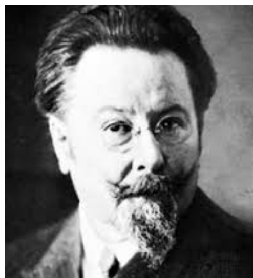
Slika 2. Emille Jaques-Dalcroze

Godine 1903. švicarski skladatelj i glazbeni pedagog održao je prvi eksperimentalni sat ritmike nakon kojeg je 1921. godine objavio zbirku „Ritam, glazba i obrazovanje“. Njegova metoda sastoji se od tri komponente: euritmija, solfeggio i improvizacija. Svalina (2015) smatra da je za kompletno glazbeno obrazovanje glazbenika potrebno da ono ravnopravno obuhvaća sva tri elementa. Vodeći se tim načelima „izumio je sustav učenja i ovladavanja ritmikom, tzv. ritmičku gimnastiku ili euritmiju“ (Hrvatska enciklopedija, 2018). Njegova ideja je bila da se osjećaj za ritam kod djece može razvijati određenim pokretima