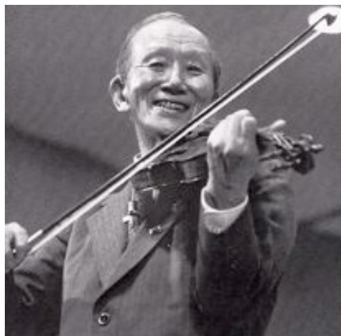
Slika 4. Shinici Suzuki

Shinici Suzuki je svoju genijalnu metodu nazvao „Metoda obrazovanja talenata“. Spomenuta metoda pobuđuje pažnju svakog glazbenog pedagoga. Ova metoda postavlja mnoga pitanja općenito o našem odgoju, a posebno o značenju glazbenog odgoja. Suvremeno proučavanje mozga danas nudi interesantne hipoteze u vezi učenja pa i učenja glazbe. Specifičnost njegove metode je što se sviranje uči slušanjem, oponašanjem i promatranjem, a najprimjenjivija dob za primjenu njegove metode je