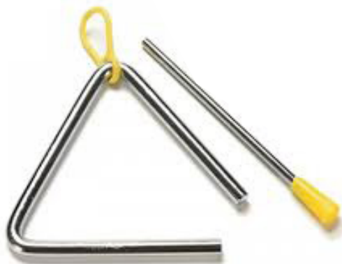
Slika 9. Triangl

Triangl je napravljen od čelične šipke savijene u obliku trokuta, sa jednim otvorenim uglom. Držimo ga obješenim o palac lijeve ruke, a zvuk dobijemo udarcem metalnog štapića koji se nalazi u desnoj ruci. Triangl je metalni trokut obješen o vrpцу na kojemu se zvuk dobiva udaranjem metalnim štapićem (Kusovac, 2010). Triangl je orkestralno glazbalo s najmanjom masom, ali najprodornijim zvukom (Dearling, 2005).