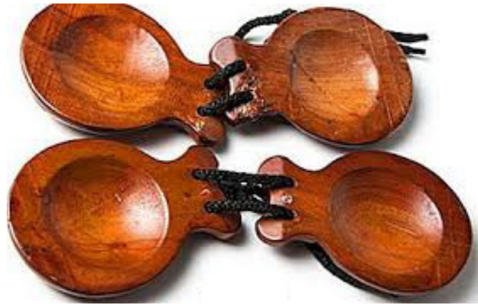
Slika 14. Kastanjete

Kastanjete su ritamske udaraljke porijeklom iz Španjolske. Školjkastog su oblika i napravljene su od komada drveta. Vežu se uzicom jedan uz drugi i za prste svirača koji ih pokretom šake ritmički udara jedan o drugi. Kusovac (2010) naglašava da se za dječju upotrebu primjenjuju kastanjete koje su pričvršćene za dršku.