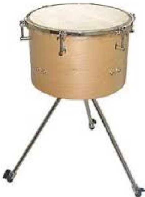
Slika 8. Timpani

Timpani su ritmičke udaraljke sa određenom visinom zvuka. Timpani su slični velikom bakrenim kotlovima preko čijih rubova je napeta koža s dva željezna obruča. Timpani Orffovog instrumentarija su drveni i puno manji. Manasteriotti (1982) navodi da su timpani jedan od najvećih i najvažnijih melodijskih udaraljki.