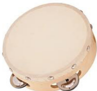
Slika 12. Tamburin

Tamburin ili def sličan je ručnom bubnju, a razlika je u metalnim tanjurićima koji su ugrađeni u drveni obruč. Pri udaranju desne ruke, prstima ili dlanom, oni zveckaju dajući karakterističan zvuk (Kusovac, 2010).