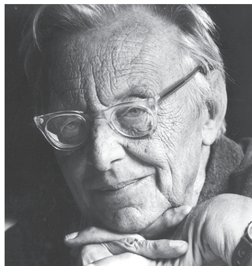
Slika 1. Carl Orff

Posebnosti tih instrumenata nude djeci s i bez teškoća, kao i odraslima, mnoge mogućnosti izražavanja zvuka koje nikad prije nisu mogli čuti. Korištenjem jednostavnih i improviziranih instrumenata djeca dublje osjete glazbene aktivnosti nego pri korištenju melodijskih instrumenata (Zalar, Kordes i Karfol, 2015). Temeljem glazbenog razvoja kod djece smatra se osjećaj za ritam koji se usvaja izvedbama i improvizacijama ritma na udaraljka. To je ujedno i prva faza glazbenog razvoja nakon koje slijedi faza imitacije. U fazi imitacije djeca razvijaju ritamske vještine ritmiziranim govorom, uporabom tijela