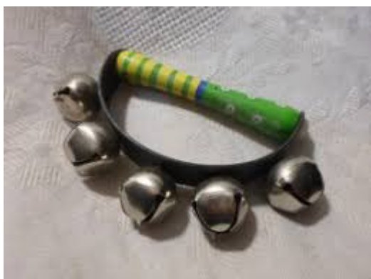
Slika 13. Praporci

Praporci se sastoje od metalne loptice u čijoj se unutrašnjosti nalazi metalna kuglica. Loptice su pričvršćene za drveni ili kožni polukrug. Praporci su nekada bili dio konjske opreme pa često njihov zvuk podsjeća na kas konja (Kusovac, 2010).