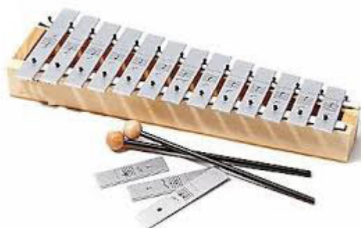
Slika 16. Metalofon

Metalofon je vrlo sličan zvončićima a sastoji se od drvenog ormarića za rezonanciju na kojem je pričvršćeno deset do dvadeset kromatski ugrađenih metalnih pločica. Kod metalofona ton se dobiva udarom palice s glavom od filca ili gume te je time zvuk tamniji i puniji. Koristi se iu suvremenoj glazbi (Jugoslavenski leksikografski zavod, 1977).