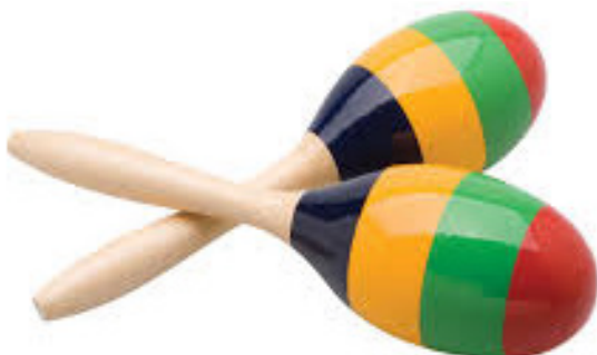
Slika 11. Zvečke (marakas)

Zvečke ili marakas su instrumenti kruškastog, valjkastog ili loptastog oblika preuzeti iz indijskog folklora. Ispunjeni su raznovrsnim zrnjem. Mogu se koristiti s drškom ili bez nje. Zvuk se dobije tako da se instrument trese naprijed-nazad (Kusovac 2010).