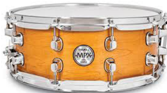
Slika 7. Mali bubanj

pomoću koje se može objesiti djetetu oko vrata (Gospodnetić, 2015). Za sviranje se upotrebljavaju lagane drvene palice (Odak, 1997).