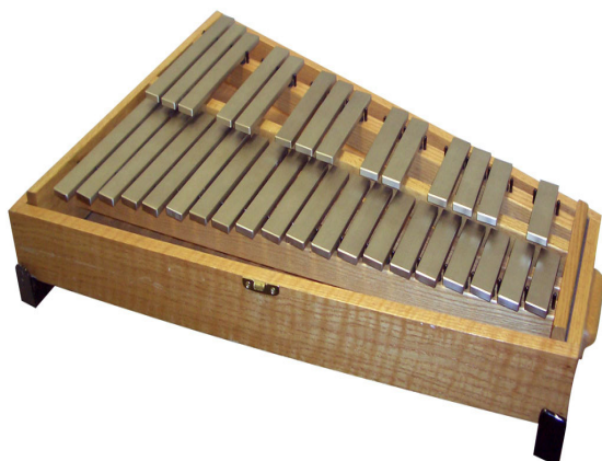
Slika 15. Zvončići

vedar. Za udaraljke se upotrebljavaju lagani metalni batići ili palice s glavama od drva (Manasteriotti, 1982).