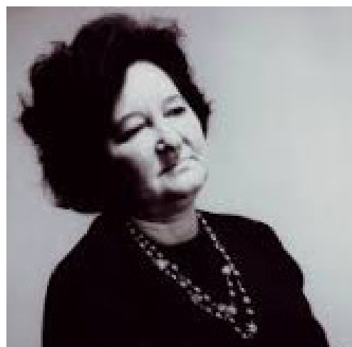
Slika 5. Elly Bašić

Hrvatska glazbena metodičarka, pedagoginja i etnomuzikologinja, Elly Bašić (1908-1998), utemeljila je glazbeno-pedagoški koncept Funkcionalna muzička pedagogija (FMP). Radi se o pristupu čiji temeljni cilj nije glazbeno obrazovanje djeteta nego razvoj njegove cjelovite ličnosti. Plan i program FMP verificiran je od strane Ministarstva znanosti obrazovanja i sporta RH, a provodi se u Glazbenom učilištu Elly Bašić u Zagrebu. Autorica je polazila od stajališta da svako dijete urednog razvoja ima maštu, sluh i osjećaj za ritam, pa prema tome ima i pravo na glazbenu kulturu. Upis u glazbenu školu Elly Bašić se odvija bez prijemnog ispita i selekcije (Letica, 2014). Osim u Zagrebu, FMP provodi se i u jednoj od glazbenih škola u Slavonskom Brodu. Osnovna funkcija škole Elly Bašić je da svojim pristupom omogući raznovrsne kontakte djeteta s glazbom u skladu s njegovom individualnošću. Prema Bačliji Sušić (2016) glazbeno-pedagoški koncept Elly Bašić FMP koji se temelji na ideji poticanja dječjeg stvaralaštva putem spontane improvizacije djece, rezultira njihovim originalnim stvaralačkim izrazom koji pomaže