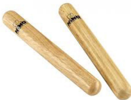
Slika 6. Štapići

Štapići ili klaves su dva obla komadića drveta dužine 20 cm. Koristimo ih uvijek u paru, tj. u svakoj ruci drži se po jedan, a zvuk se dobije udarom jednog o drugi kako bi pružili ritmičku pratnju (Dearling, 2005). Kusovac (2010) navodi da je zbog kvalitete zvuka potrebno jedan štapić staviti iznad poluzatvorenog dlana te po njemu udarati drugim štapićem.