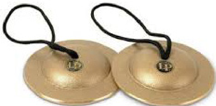
Slika 10. Činele

Činele su okrugle brončane pločice nalik tanjuru. Možemo ih koristiti u paru ili pojedinačno. Zvuk se dodiva udaranjem i dugo traje, a možemo ga prekinuti pritiskom prsta ili dlana o činelu. Činele mogu biti različitih veličina koje doprinose i različitoj visini zvuka. Zvuk se proizvodi udarom jedne činele u drugu, ali i pomoću batića ako koristimo samo jednu činelu (Kusovac 2010).