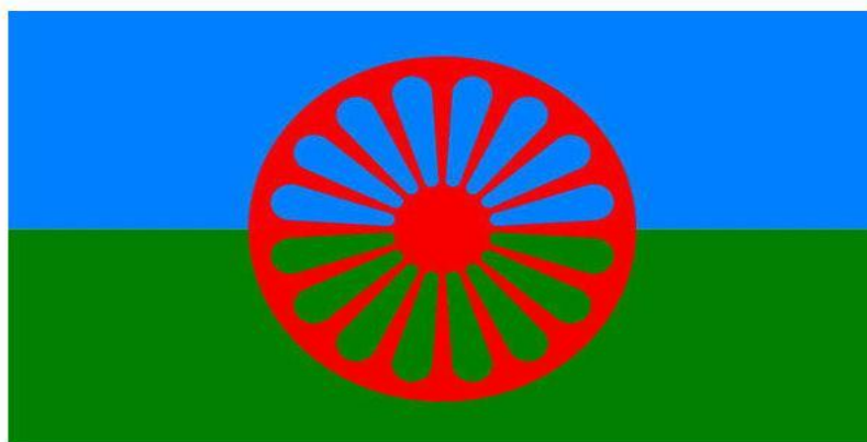
Slika 2. Prikaz romske zastave (Romska Kultura, 2013)

Romska zastava sastoji se od dvije osnovne boje, zelene i plave, a u sredini zastave nalazi se kotač. Zelena boja simbolizira slobodu kretanja i neograničeno prirodno prostranstvo dok je plava simbol nebeskog prostranstva. Kotač u sredini zastave simbolizira vječno putovanje Roma ( Bakić-Tomić i sur., 2014).