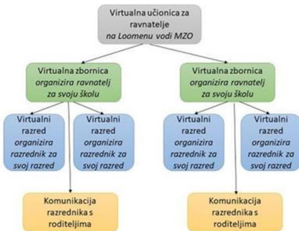
Slika 8 Prikaz strukture virtualnih učionica (Škola za život, 2020).

Sljedeća ilustracija prikazuje strukturu i način funkcioniranja virtualnih učionica, odnosno virtualnih komunikacijskih kanala i razreda: