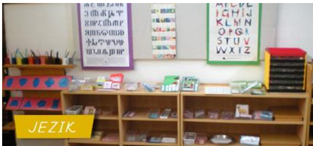
Slika 7 Pribor za jezik