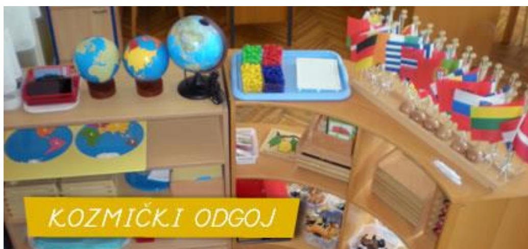
Slika 9 Pribor za kozmički odgoj