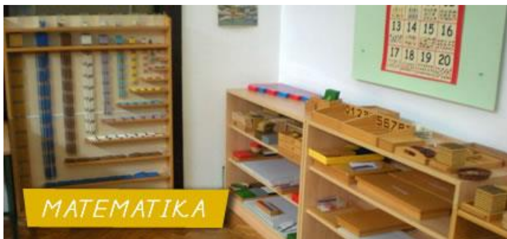
Slika 8 Pribor za matematiku