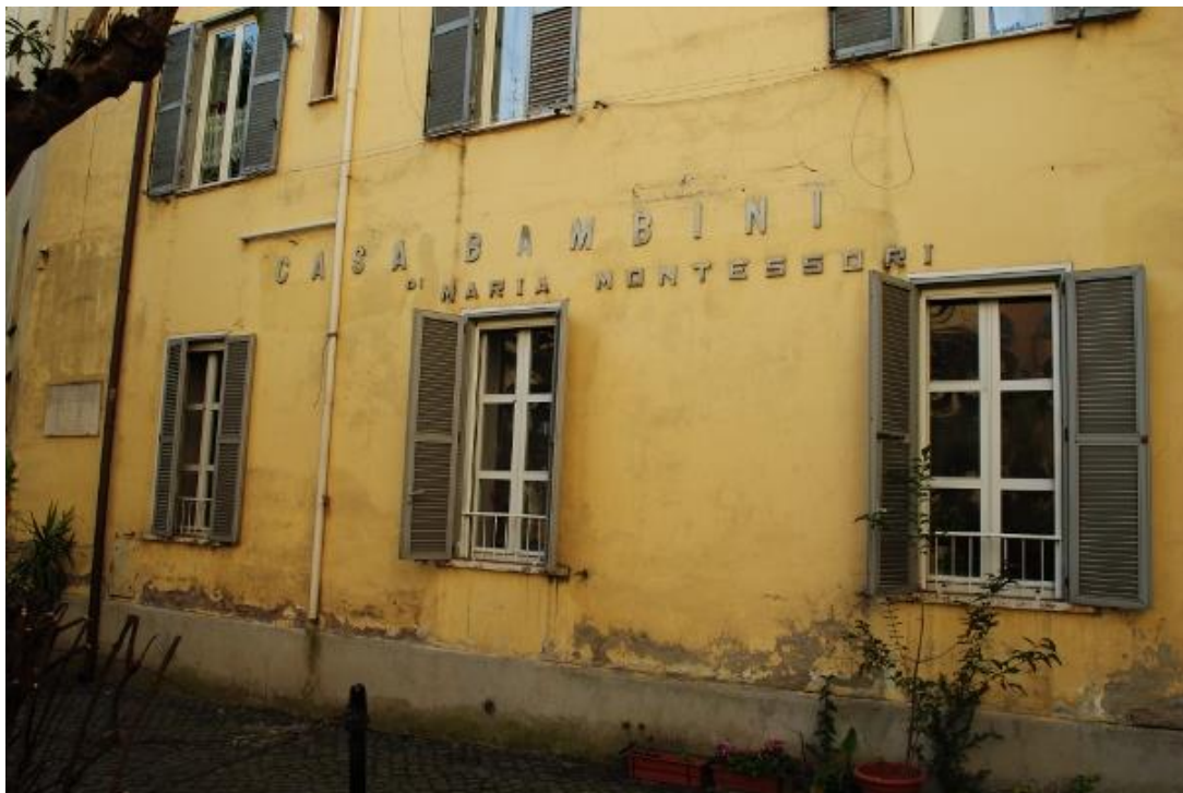
Slika 2 Dječja kuća (Casa dei Bambini)

nesputanosti i otvorenosti, djeca su ubrzo počela ostavljati dojam izvanredne discipline. Mirno su radila i svatko je bio zaokupljen svojim poslom. Nakon nekog vremena polako bi ustajali sa svog mjesta i zamjenjivali pribor. Iznenadjuće brzo su počela slušati naredbe učiteljice. Usprkos toj poslušnosti, djeca su djelovala po svojoj inicijativi, raspolažući svojim vremenom. Sama su uzimala predmete, uređivala školu. Ubrzo se primijetila veliku povezanost reda i discipline sa spontanošću. Disciplina mora proizaći iz slobode, što je teško shvatiti sljedbenicima metoda tradicionalne nastave. Ako se disciplina temelji na slobodi, ona svakako mora biti aktivna. Učiteljica je također je samoinicijativno naučila djecu vojni pozdrav, iako najstariji učenici nisu imali više od pet godina. Djeci se to jako sviđjelo i bili su izrazito zadovoljni. Tako je započet rad koji u početku nije davao nikakve nade za uspjeh (Montessori, 2003).