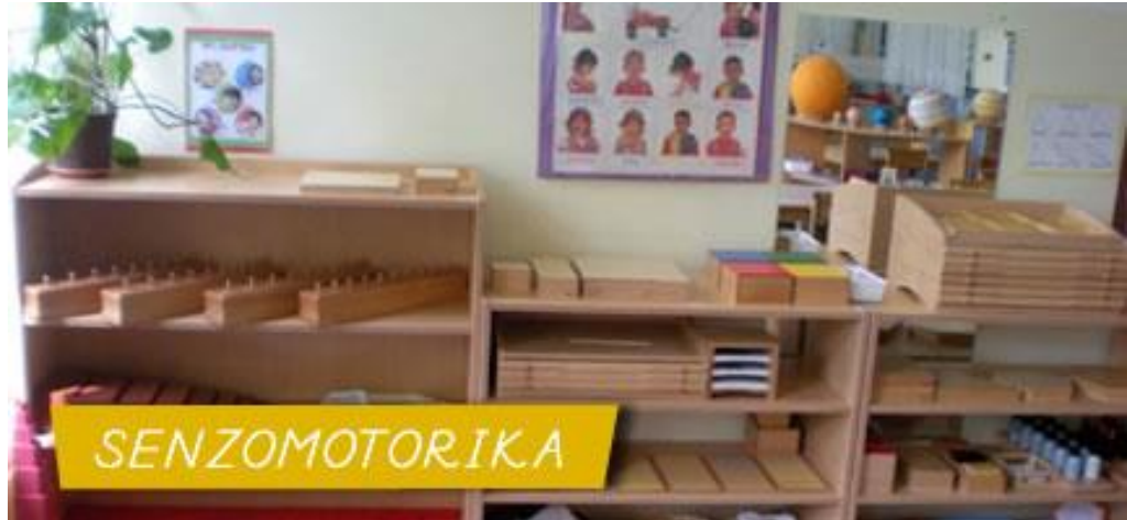
Slika 6 Pribor za osjetilne sposobnosti