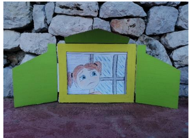
Slika 7. Ilustracija 2. 2 Izvor: Autorica rada, 27.8.2021.