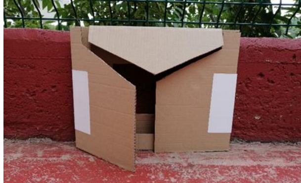
Slika 20. Izrada butaja