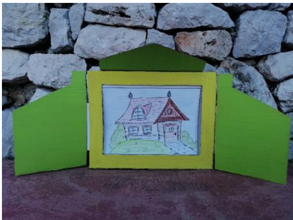
Slika 6. Ilustracija 1.