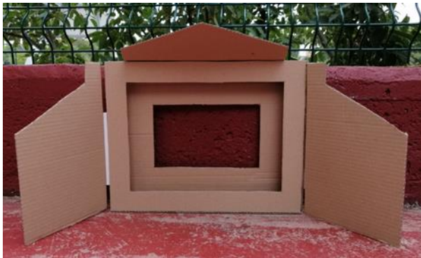
Slika 19. Izrada butaja