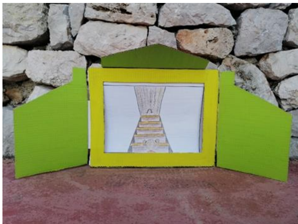
Slika 8. Ilustracija 3.