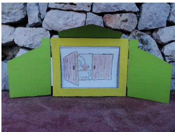
Slika 10. Ilustracija 5. Izvor: Autorica rada, 27.8.2021.)