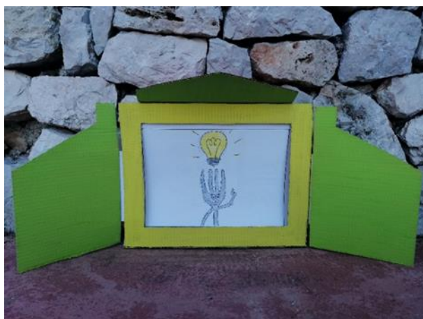
Slika 12. Ilustracija 7.