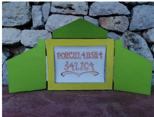
Slika 5. Naslovnica