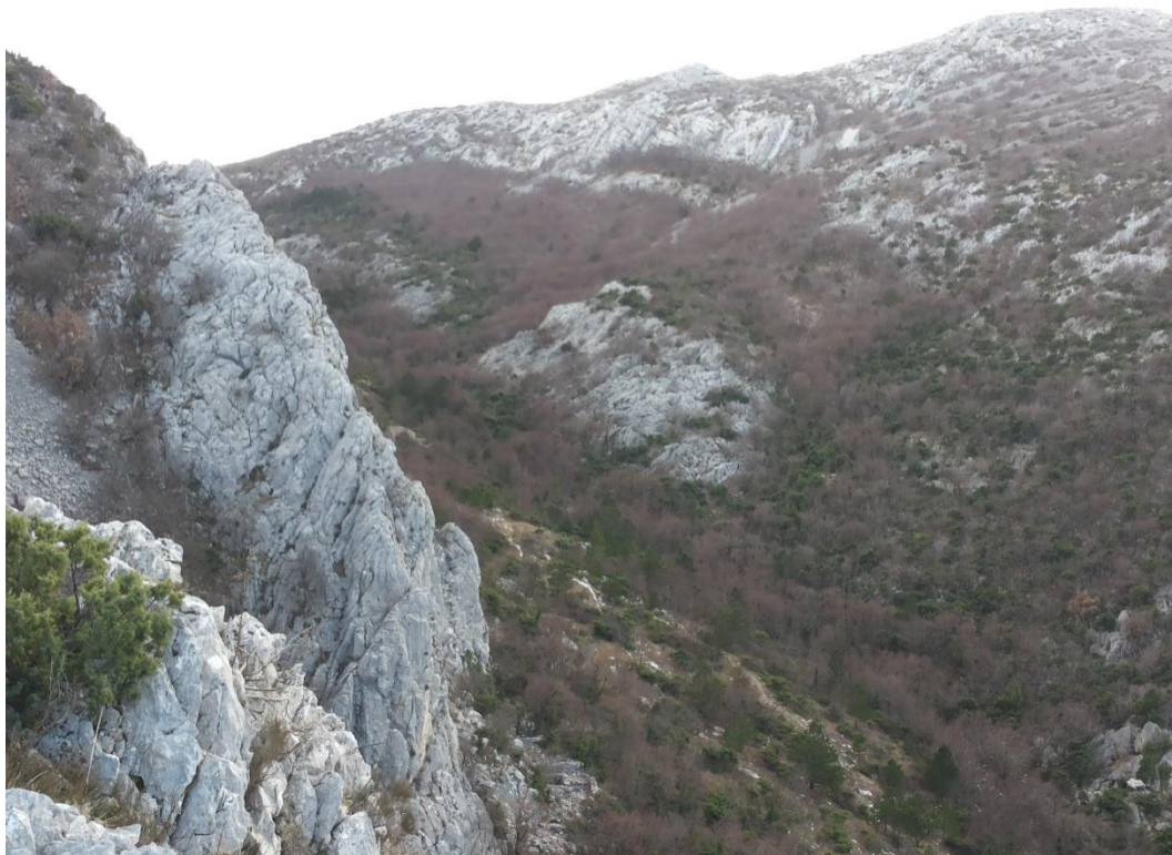
Slika 4. Mjesto na kojem su se okupljale vještice