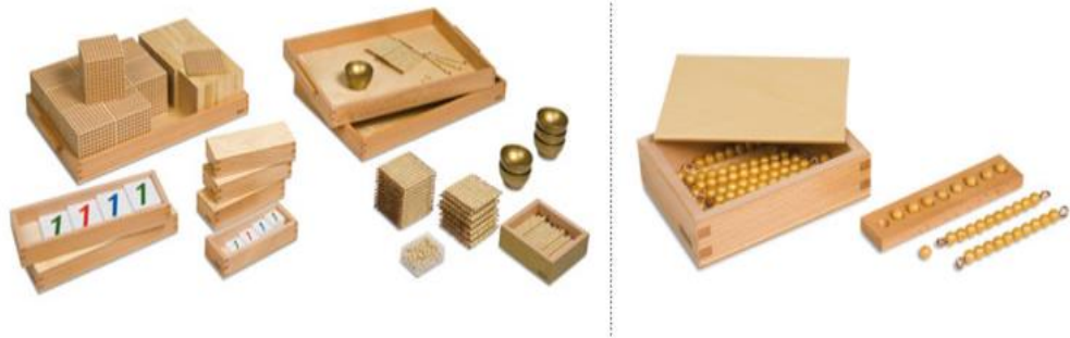
Slika 6. Pribor za matematiku

predstavlja primjerice promjenu šipke. Na taj način dijete spoznaje strukturu decimalnog sustava (Seitz i Hallwachs, 1996).