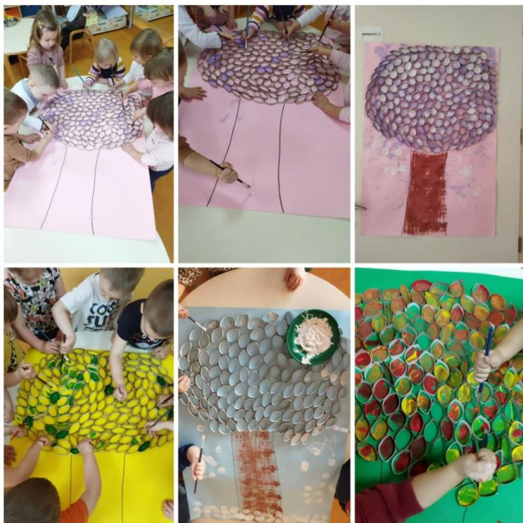
Slika 16. Stabla od kartona