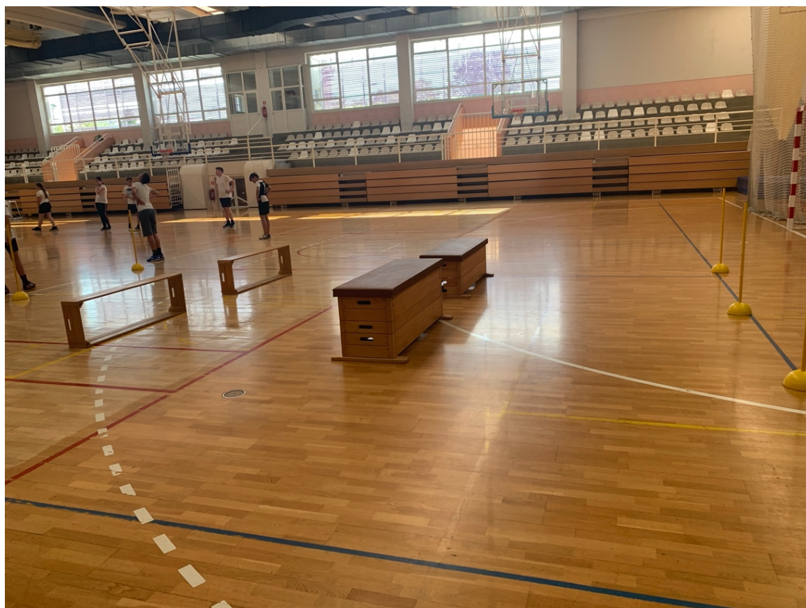
Fotografija 4. Radna stanica za poligon natraške