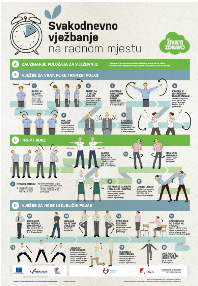
Slika 2. Plakat vježbanje za odrasle (Hrvatski zavod za javno zdravstvo, 2018)