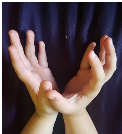
Slika 22 Ruke u položaju "otvorenog" cvijeta