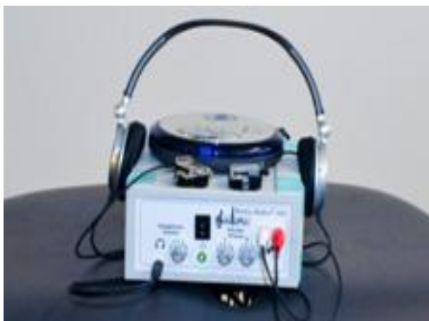
Slika 6. Musica Medica aparatura (sastoji se od dvije male vibracijske sonde, slušalica, posebno dizajniran zvučnik)