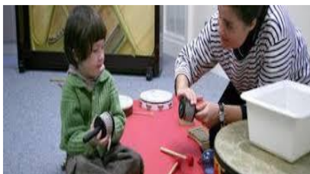
Slika 2. Orffova individualna terapija (dijete s glazboterapeutom upoznaje cabasu)