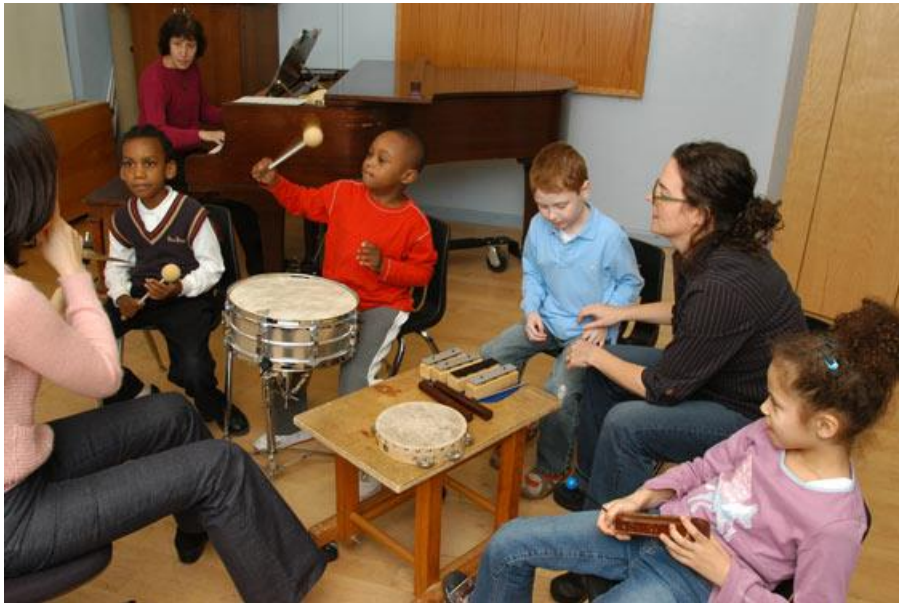
Slika 4. Skupna Nordoff-Robbinsonova glazboterapija (djeca s glazboterapeutom sviraju guiro, ksilofon, bubnjeve i klavir)

može voditi više računa o konkretnim potrebama pojedinog djeteta. Bruscia (1988) smatra da se kreativna glazboterapija provodi se u tri proceduralne faze, a to su: glazbeni susret, evocirani glazbeni odgovor putem glazbene improvizacije i unapređenje glazbenih sposobnosti, izražajna sloboda, međuodgovornost terapeuta i pacijenta. Navedene faze odvijaju se spontano prateći pacijentove reakcije. Stoga je ponekad kod nekih pacijenata cijela terapija posvećena prvoj fazi, dok drugi pacijenti prolaze kroz sve faze i ponavljaju ih nekoliko puta.