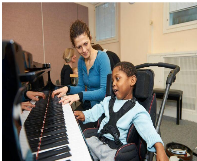
Slika 5. Individualna Nordoff-Robbinsonova glazboterapija (glazboterapeut s dječakom svira klavir)