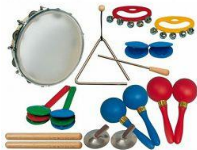
Slika 1. Orffov instrumentarij (tamburin, trianql, zvončići, kastanjete, udaraljke, činela, zvečke)