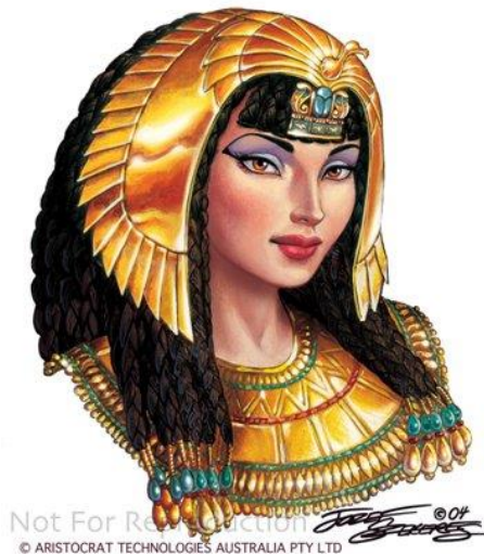
Slika 5 Kleopatra VII.

Nakon što je Cezar ubijen od strane svoga sina Brutusa, Kleopatra, kako bi očuvala svoj položaj, počela se nalaziti s Cezarovim generalom i pristalicom Markom Antonijem. S njim se vjenčala po egipatskim propisima te s njim dobila djecu. Kasnije će se Kleopatra boriti u ratu protiv Oktavijana Augusta te će izgubiti i Egipat će postati rimskom provincijom. Zbog poraza i poniženja od strane Oktavijana, Kleopatra je počinila samoubojstvo tako da je dala da ju ugrizu zmiје otrovnice, vjerujući da će joj to zbog egipatskih vjerovanja dati besmrtnost. Iako je bila iznimno sposobna vladarica te je Egipat u doba njezine vladavine napredovao, Kleopatra je u povijesti zapamćena samo kao iznimno lijepa žena, a ne superiorna kraljica.“ 16