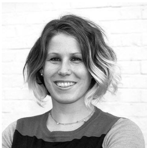
Slika 14 Caroline Criado-Perez

„Prve naznake četvrtog vala pojavile su se u Velikog Britaniji. U srpnju 2013. godine, nemali broj žena okupio se u Engleske centralne banke odjevene u poznate povijesne ličnosti – avijatičarke, sufražetkinje i kraljice ratnice – kako bi tražile veću zastupljenost žena na britanskim novčanicama. Prosvjed je organizirala 29-godišnja aktivistica Caroline Criado-Perez.“ 45 Nedugo nakon toga, 24-godišnja Ikamara Larasi započela je kampanju za rješavanje rasističkih i seksističkih stereotipa putem glazbenih videozapisa.