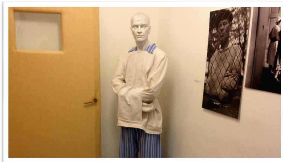
Slika 1.2. Stezulja.