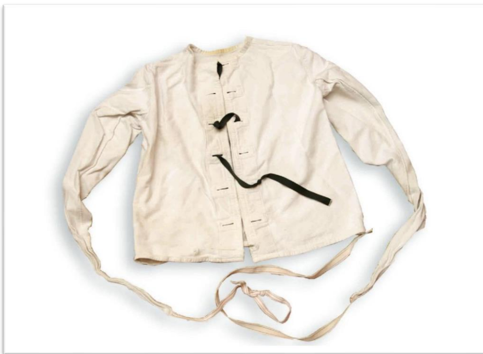
Slika 1.1. Stezulja. Izvor: http://balkans.aljazeera.net/sites/default/files/styles/d8/public/muzej_promo_ajb.jpg?itok=4amU97iB , (Datum pristupa: 4.7.2018.)