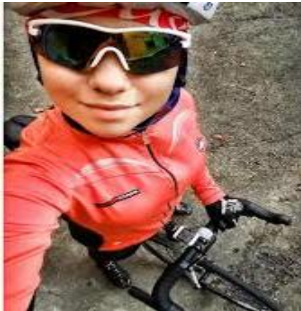
Slika 8.7.3. Bicikliranje