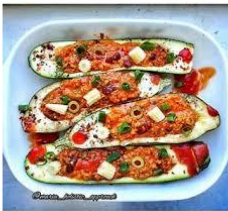
Slika 8.7.7. Veganska prehrana