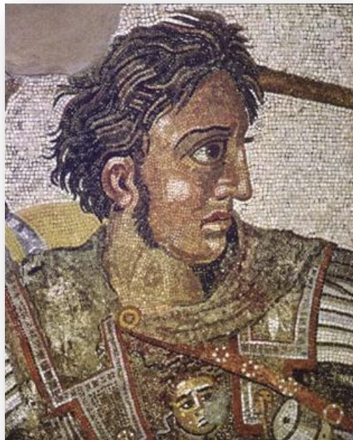
Slika 2.1. Aleksandar Veliki

O tome tko je prva slavna osoba u ljudskoj povijesti vodilo se dosta rasprava i stvorila su se različita mišljenja. Ipak se većina autora, među njima i Braudy, slažu kako je to bio vojskovođa i osvajač Aleksandar Veliki. Iako nije bio prva osoba koja je htjela pokoriti svijet putem vojnih osvajanja, svakako je bio prvi koji je htio svu čast i slavu pribaviti za sebe kao pojedinca. Htio je postati opće prisutan dio svakodnevnog života tadašnjih ljudi. Inspirirali su ga grčki junaci i ostali heroji čija je djela htio ponoviti te na taj način od sebe napraviti statusnu ikonu i simbol besmrtnosti. U tome je i uspio (2000: 14). Među prve slavne osobe mogu se još uvrstiti i rimski carevi koji su bili štovani poput bogova te su uživali u poštovanju i moći koju su posjedovali. Tome su pridonijeli i gladijatori koji su svojim borbama na život i smrt odavali počast caru i njegovom liku. I antička Grčka je imala svoje gladijatore, tj. sportaše koji su se natjecali na Olimpijskim igrama, a pobjednici bi svojom spretnošću i snagom bili dugo slavljani među narodom.