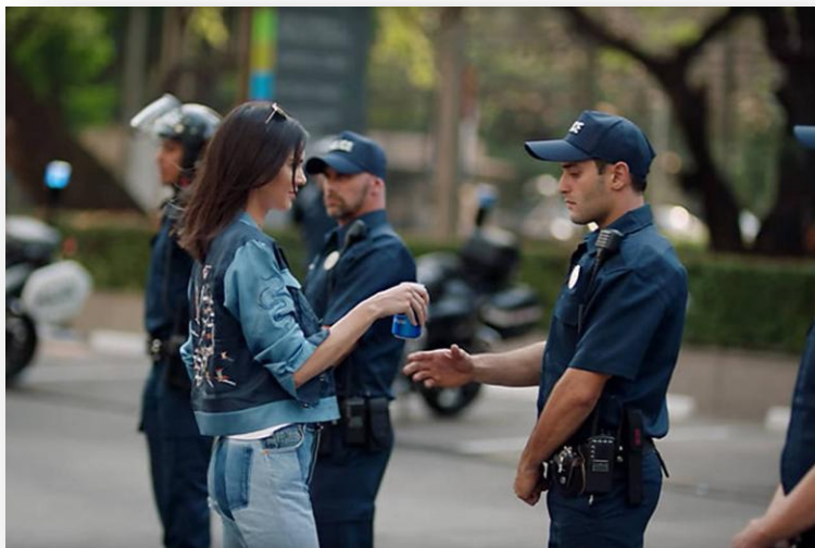
Slika 3.5. Kontroverzna Pepsi reklama s Kendall Jenner