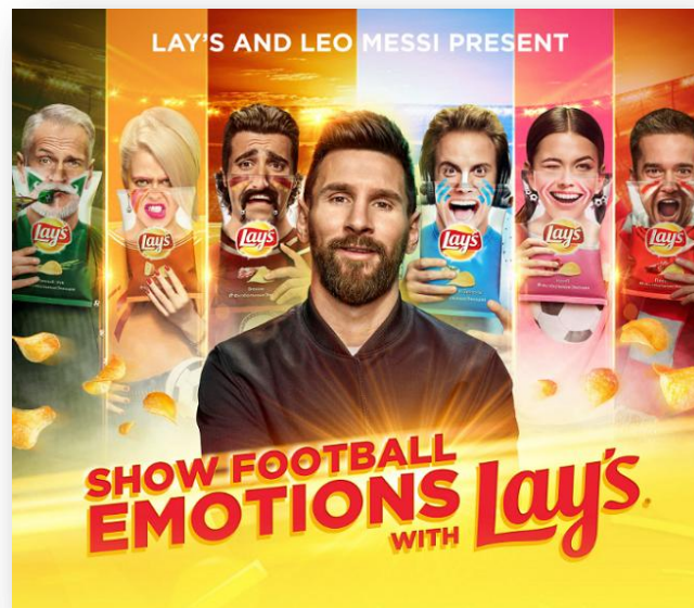
Slika 3.4. Lionel Messi reklamira čips „Lays“ (izvor: https://www.virtuallnedia.pl/artykul/leo-messi-reklama-lay-s-na-mundial-wideo )

Neki od najpoznatijih primjera poznatih osoba u reklamama su nogometaši (Lionel Messi u reklami za „Lays“ čips, Neymar za „Gilette“ britvice, Robert Lewandowski za „Head & Shoulders“ šampon za kosu...), manekenke (Adriana Lima za „Maybeline“ ruž, Barbara Palvin za „L'oreal Paris“ liniju za čišćenje kože lica, Heidi Klum za vlastitu liniju odjeće u trgovačkom lancu „Lidl“...), glumci i glumice (Rene Bitorajac, Goran Navojec i Goran Bogdan za „Ožujsko pivo“, Gla Gadot za smartphone „Huawei“, Eva Longoria za „L'oreal Paris“ puder, Chris Hemsworth i Jamie Dornan za parfem „Hugo Boss“...), pjevači i pjevačice (Cardi B za „Reebok“ tenisice, Camila Cabello za „Skechers“ tenisice, Shawn Mendes za „Armani“ satove...) i dr. Ova vrsta promidžbe proizvoda korisna je za tvrtke, a pogotovo celebrityje . I jednima i drugima povećava se bankovni račun, publicitet kroz medije te cjelokupni javni imidž. Ono što je također važno izdvojiti je način na koji se slavni putem reklama približavaju publici. Oni svoj postojeći imidž prenose na proizvod kojeg promoviraju i time kreiraju određenu simboliku, a to utječe na kupce koji to prepoznaju i na temelju toga kupuju proizvod. Logika je sljedeća: ako je dovoljno dobro za celebrityje , onda je i za ostale.