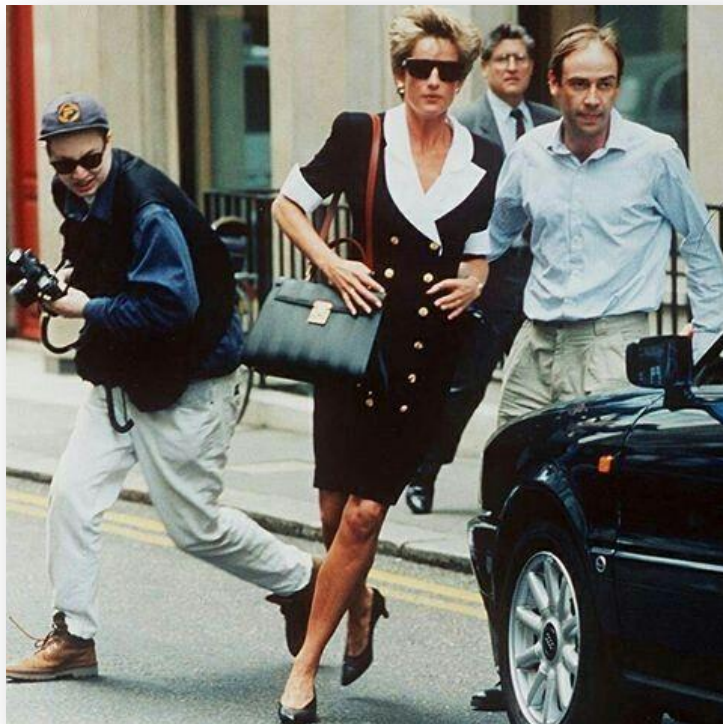
Slika 3.1. Princeza Dijana pokušava pobjeći od paparazza