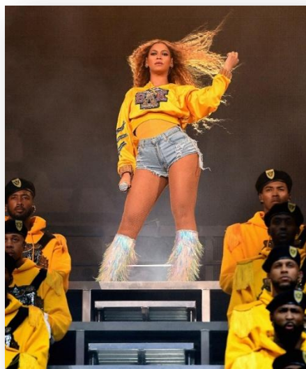
Slika 2.2. Nastup Beyonce na glazbenom festivalu Coachella